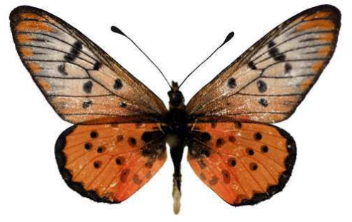
zoumi, Toro, Kitgum, Ouganda Bernaud (Cat EB).jpg zoumi