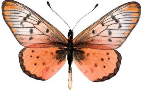
zoumi mâle, Agoro Agu (Ouganda).jpg zoumi