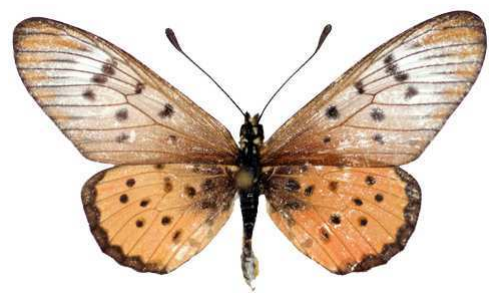
zoumi femelle, Agoro Agu (Ouganda).jpg zoumi