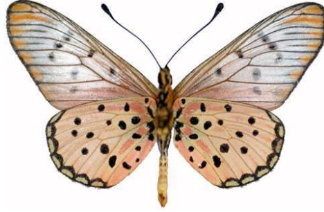
zoumi mâle verso, Agoro Agu (Ouganda).jpg zoumi