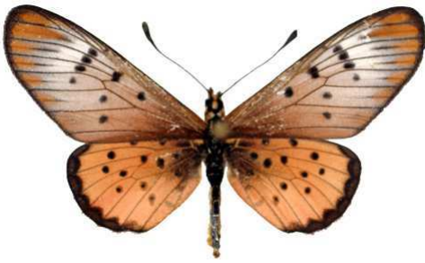
zoumi femelle, Agoro Agu (Ouganda) 9-2000 Cat EB Bernaud.jpg zoumi