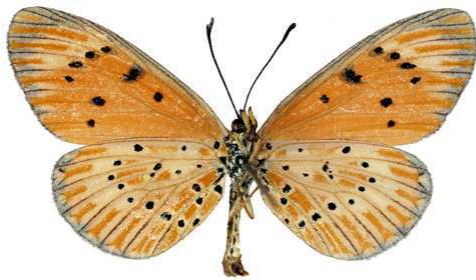
zitja femelle verso, Anosibe (Madagascar).jpg