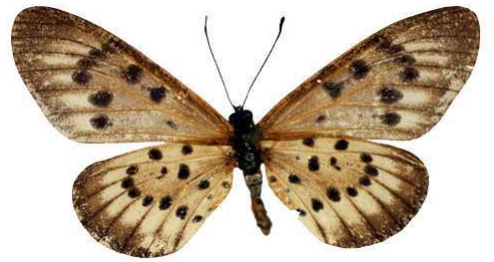
zitja, femelle blanche, Tananarive, Madagascar MNHN (Cat EB).jpg