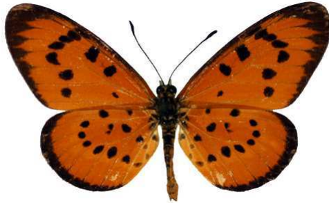
zitja, Majunga, Madagascar MNHN (Cat EB).jpg