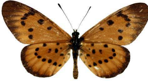
zitja, femelle, Tananarive, Madagascar MNHN (Cat EB).jpg