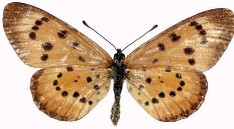
zitja femelle Tananarive (Madagascar) Cat EB Bernaud.jpg