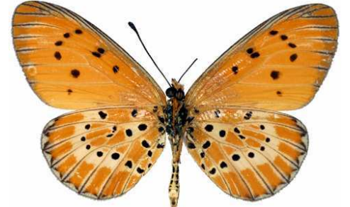
zitja mâle verso, La Mandraka (Madagascar).jpg