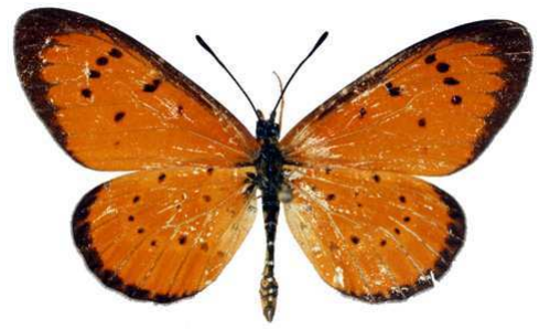
zitja mâle (Madagascar).jpg