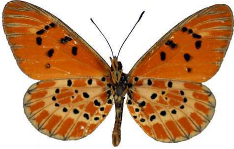
zitja, verso, Tananarive, Madagascar MNHN (Cat EB).jpg