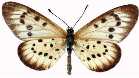
zitja femelle (Madagascar) Cat EB Bernaud.jpg