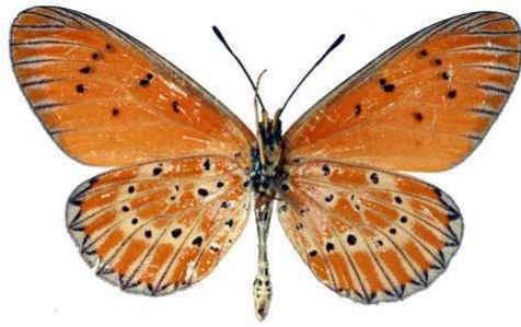
zitja mâle verso (Madagascar).jpg