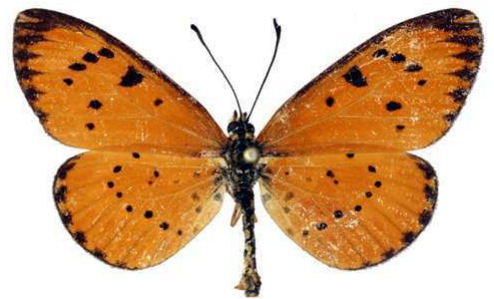
zitja femelle, Anosibe (Madagascar).jpg