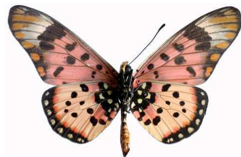
zetes mâle 2 verso, Mt Napak (Ouganda).jpg menippe