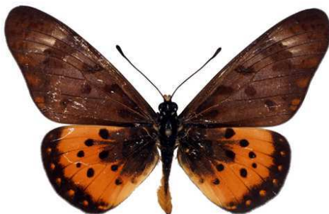
zetes mâle, Ilaro fst (Nigeria).jpg zetes