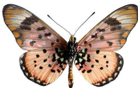
zetes mâle verso, Mt Napak (Ouganda).jpg zetes