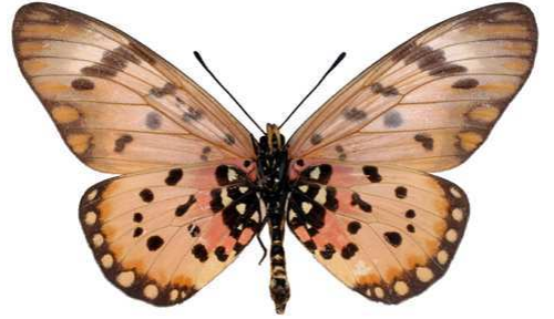
zetes femelle, verso, Napak mt (Ouganda).jpg zetes