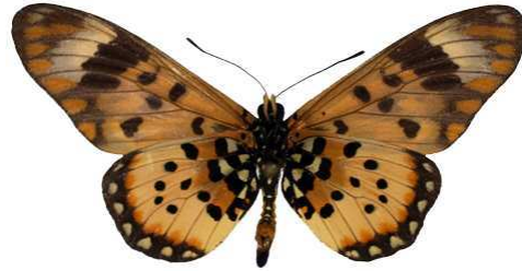
zetes, verso, Beni, Kivu, RD Congo MNHN (Cat EB).jpg zetes