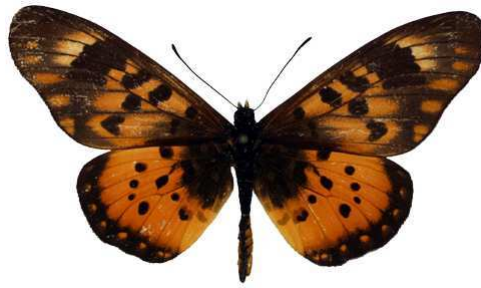
zetes mâle 2 (Cat EB).jpg zetes