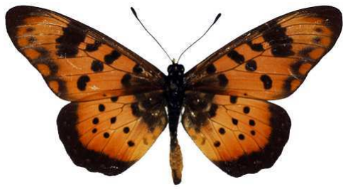
zetes mâle 4 (Cat EB).jpg zetes