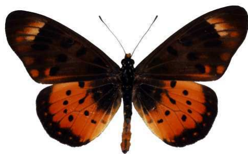
zetes mâle, Chinteche - Chisasira fst (Malawi) RM.jpg zetes