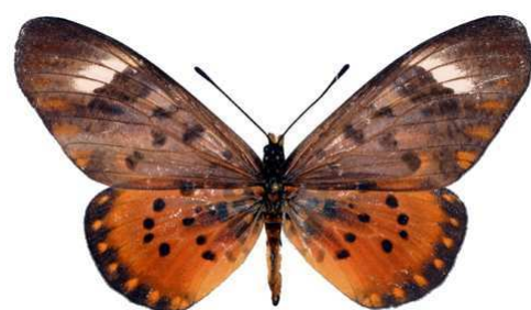
zetes femelle 2, Napak mt (Ouganda).jpg zetes