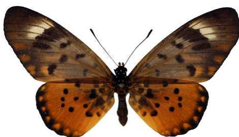
zetes, femelle, Kribi, Cameroun Bernaud (Cat EB).jpg zetes