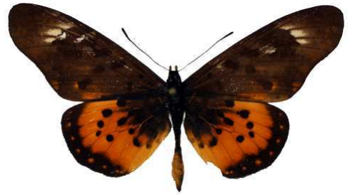
zetes mâle 1 (Cat EB).jpg zetes