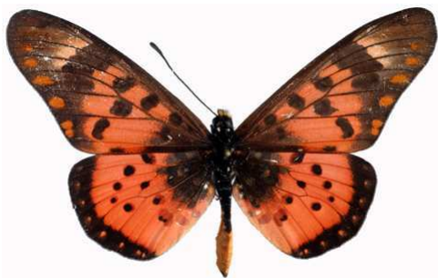
zetes mâle 2, Mt Napak (Ouganda).jpg menippe