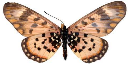
annobona, femelle, verso, Bombaïm, Sao tome et Principe, 77.JPG annobona