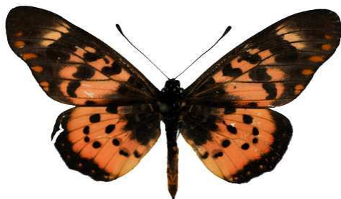
zetes annobona, Sao Tome Bernaud (Cat EB).jpg annobona