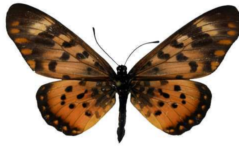
zetes annobona, femelle, Sao Tome Bernaud (Cat EB).jpg annobona