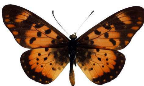
zetes mâle 3 (Cat EB).jpg zetes