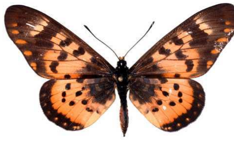
annobona, mâle, recto, Bombaïm, Sao tome et Principe, 67.JPG annobona