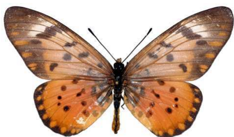
zetes femelle, Napak mt (Ouganda).jpg zetes