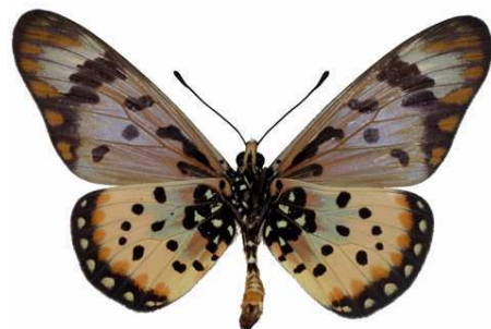
zetes mâle, verso, Ilaro fst (Nigeria).jpg zetes