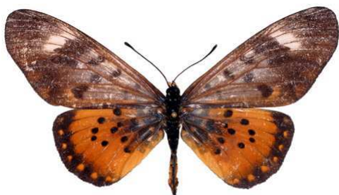
zetes femelle, Oban hill (Nigeria).jpg zetes