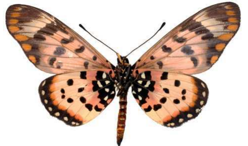
annobona, mâle, verso, Bom Successo, Sao tome et Principe, 62.JPG annobona