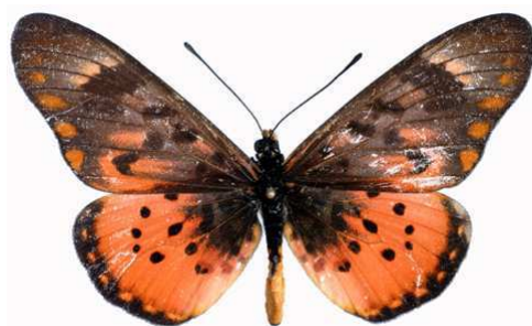
zetes mâle, Mt Napak (Ouganda).jpg zetes