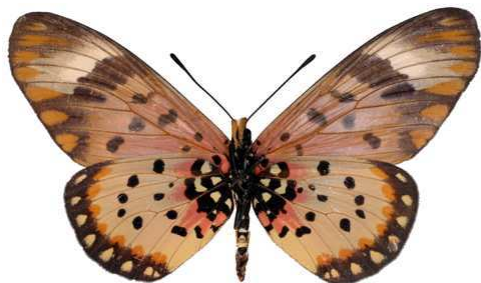
zetes femelle 2, verso, Napak mt (Ouganda).jpg zetes