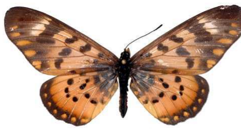
annobona, femelle, recto, Bombaïm, Sao tome et Principe, 77.JPG annobona