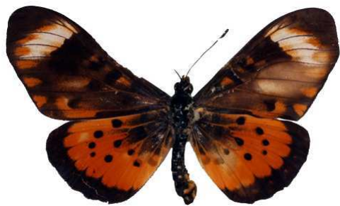
zetes femelle, Livingstonia (Malawi) RM.jpg zetes