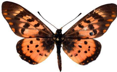
annobona, mâle, recto, Bom Successo, Sao tome et Principe, 62.JPG annobona