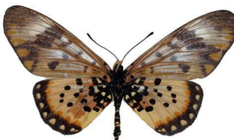
zetes femelle, verso, Oban hill (Nigeria).jpg zetes