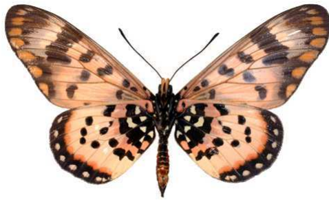
annobona, mâle, verso, Bombaïm, Sao tome et Principe, 67.JPG annobona