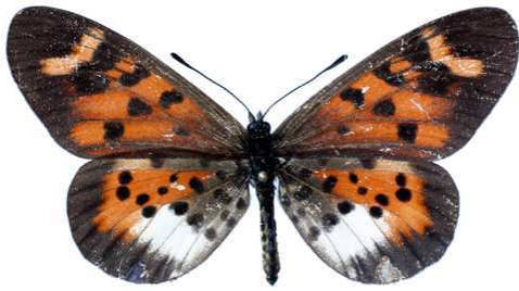
vuilloti, femelle, Uluguru mount (Tanzanie) Lequeux 61.JPG vuilloti