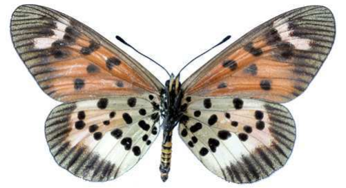
vuilloti, femelle, verso, Uluguru mount (Tanzanie) Lequeux 61.JPG vuilloti