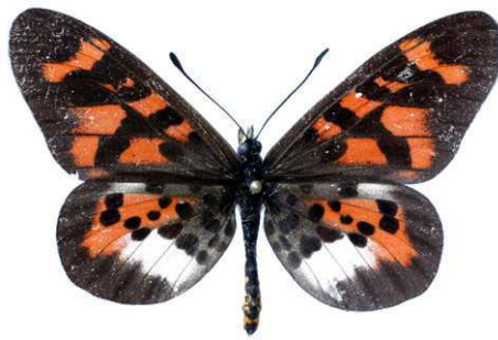
vuilloti, Uluguru mount (Tanzanie) Lequeux 51.JPG vuilloti