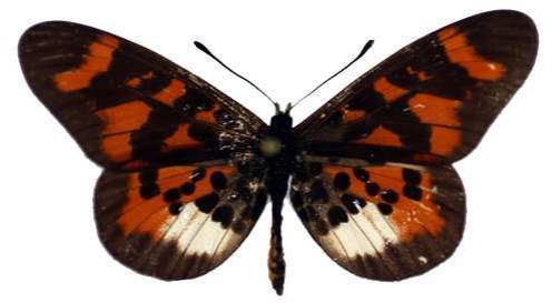
vuilloti, Nguru, Tanzanie MNHN (Cat EB).jpg vuilloti