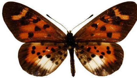
vuilloti femelle, Uluguru (Tanzanie).jpg vuilloti