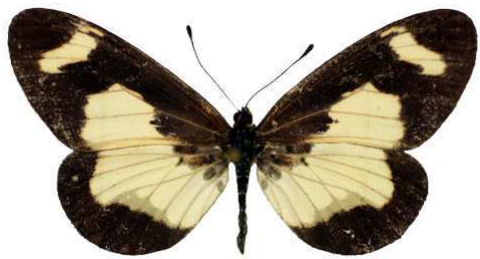
viviana, femelle, mt Kogam, Cameroun Bernaud (Cat EB).jpg viviana