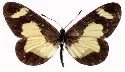
viviana femelle, Itwara fst (Ouganda).jpg viviana