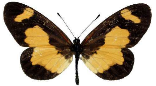
viviana, mt Messa, Yaoundé, Cameroun Bernaud (Cat EB).jpg viviana