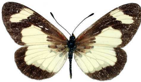
viviana femelle, Leinde Fadali (Nigeria).jpg viviana