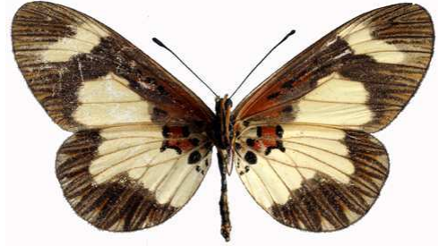
viviana femelle verso, Buvuma island (Ouganda).jpg viviana