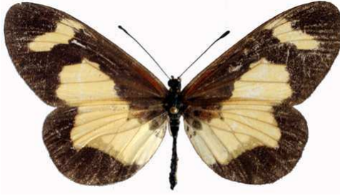
viviana femelle, Buvuma island (Ouganda).jpg viviana