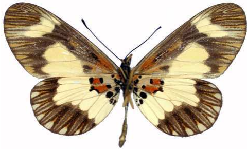
viviana mâle, Mawokota (Ouganda).jpg viviana