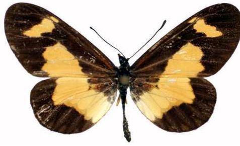
viviana mâle verso, Mawokota (Ouganda).jpg viviana