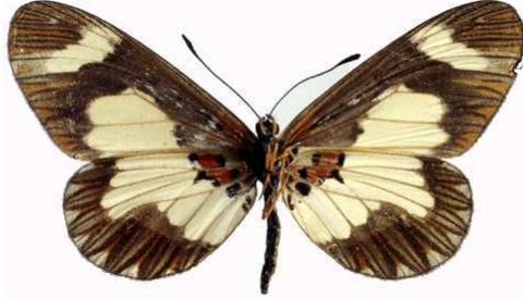
viviana femelle verso, Itwara fst (Ouganda).jpg viviana