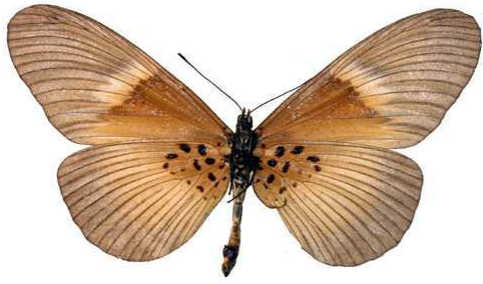
umbra, femelle, verso, Ile Roumi, Guinee, 79.JPG