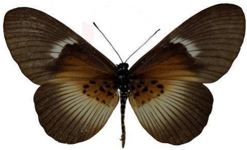
umbra, femelle, île de Los, Guinée MNHN (Cat EB).jpg