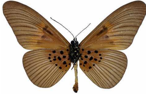
umbra mâle, verso, Isheri fst (Nigeria).jpg