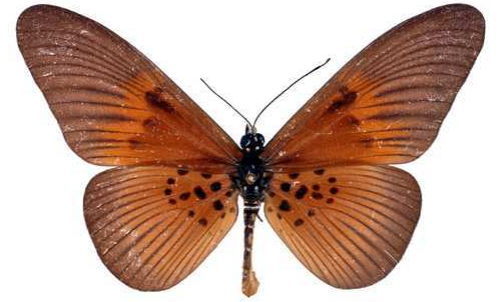
umbra mâle, Isheri fst (Nigeria).jpg