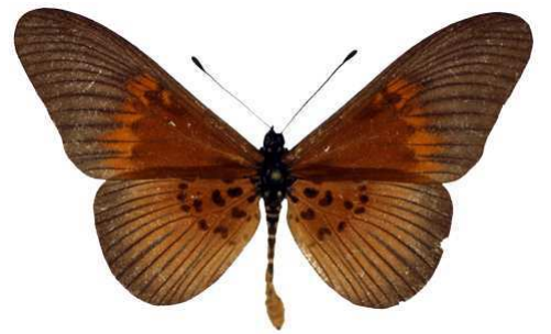
umbra, Banco Côte d'Ivoire Bernaud (Cat EB).jpg