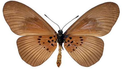
umbra femelle, verso Sapoba (Nigeria).jpg