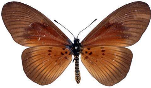
umbra femelle, Sapoba (Nigeria).jpg