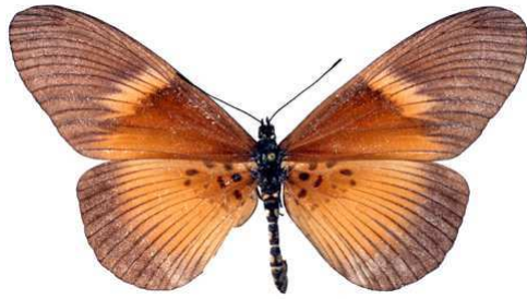
umbra, femelle, recto, Ile Roumi, Guinee, 79.JPG