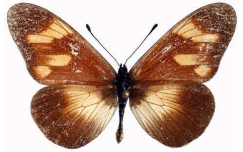
toruna mâle, Ruhiza fst (Ouganda).jpg toruna