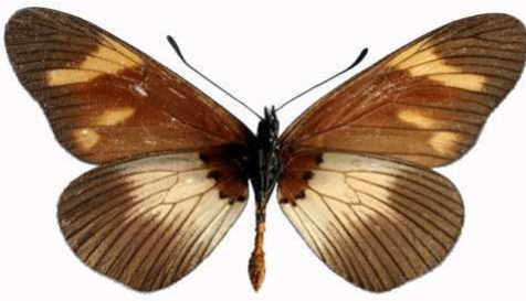
toruna mâle verso, Echuya fst (Ouganda).jpg toruna