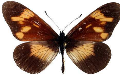
toruna femelle, Echuya fst (Ouganda).jpg toruna