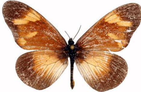
toruna mâle, Kisubi (Ouganda).jpg toruna