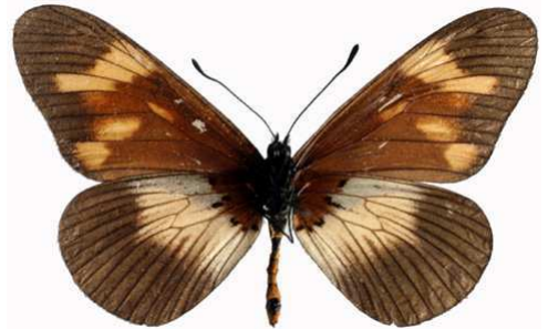
toruna femelle verso, Echuya fst (Ouganda).jpg toruna