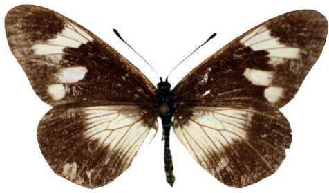
toruna, femelle, Nyungwe ft, Ruanda MNHN (Cat EB).jpg toruna