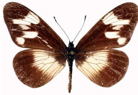
toruna femelle, Bugaram (Burundi) 7-86 Cat EB Bernaud.jpg toruna