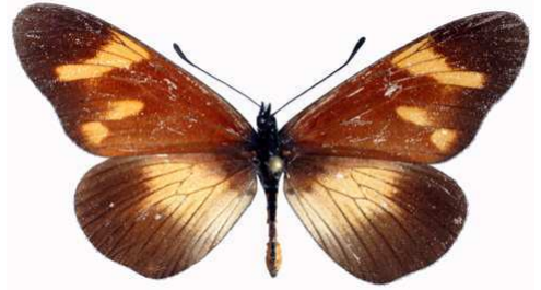
toruna mâle, Echuya fst (Ouganda).jpg toruna