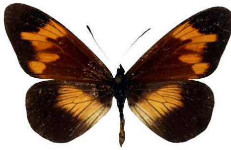
toruna, Butuhe, Kivu, RD Congo MNHN (Cat EB).jpg toruna