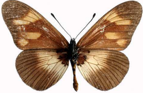
toruna mâle verso, Ruhiza fst (Ouganda).jpg toruna