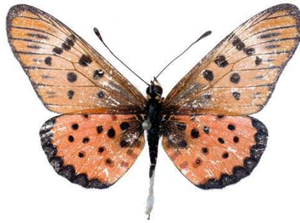
sykesi, mâle, recto, Metu hills, Ouganda, 47.JPG sykesi