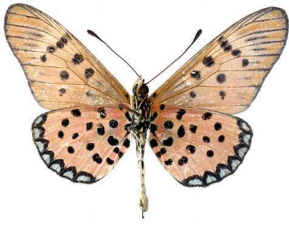
sykesi, mâle, verso, Metu hills, Ouganda, 47.JPG sykesi