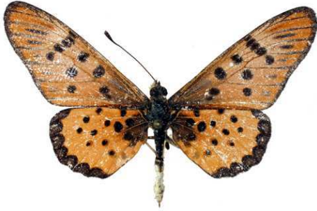
sykesi mâle, Gordil (RCA).jpg sykesi