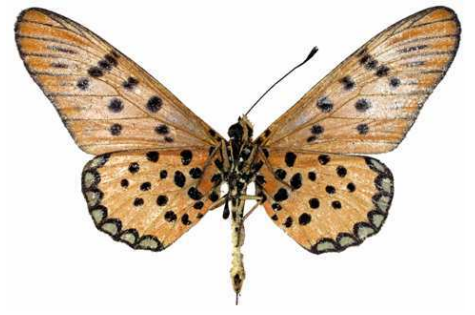
sykesi mâle, verso, Gordil (RCA).jpg sykesi