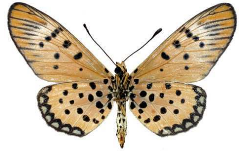
sykesi femelle, verso, Maroua (Cameroun).jpg sykesi