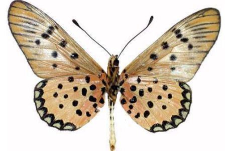
sykesi mâle verso, Agoro Agu (Ouganda).jpg sykesi