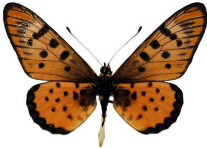
sykesi, Maroua, Cameroun Bernaud (Cat EB).jpg sykesi