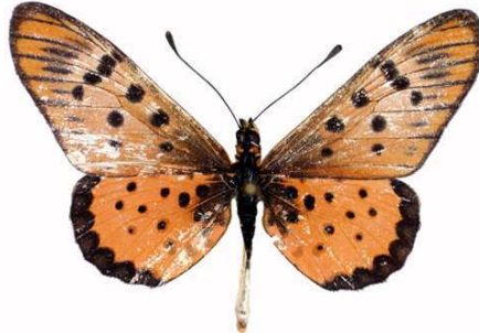
sykesi mâle, Agoro Agu (Ouganda).jpg sykesi