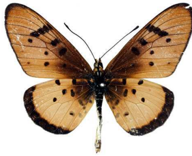
stenobea mâle, Tsumkwe (Namibie).jpg stenobea