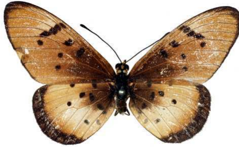
stenobea femelle.jpg stenobea