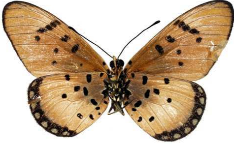
stenobea femelle, verso.jpg stenobea