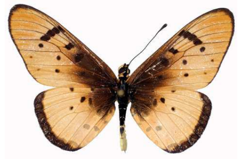
stenobea mâle, Tsumep (Namibie) 3-98 Cat EB Bernaud.jpg stenobea