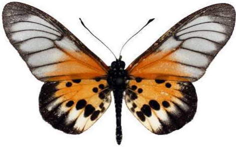
silia, Antsianaka, Madagascar MNHN (Cat EB).jpg silia