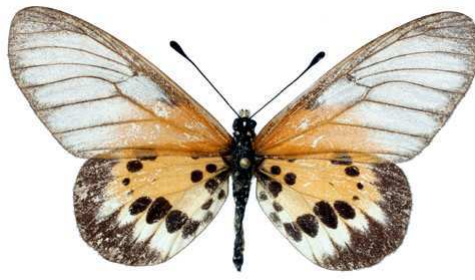
silia, femelle, Tananarive (Madagascar) Vieu 53.JPG silia