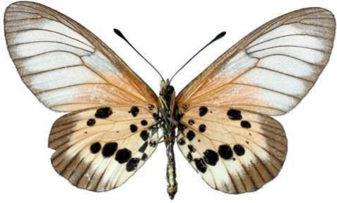
silia, femelle, verso, Tamatave rd Km 30 (Madagascar) Chaminade 53.JPG silia