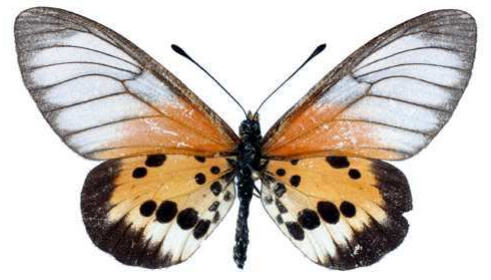
silia, femelle, Tamatave rd Km 30 (Madagascar) Chaminade 53.JPG silia