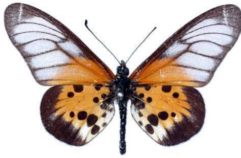
silia, Tananarive (Madagascar) Vieu 49.JPG silia