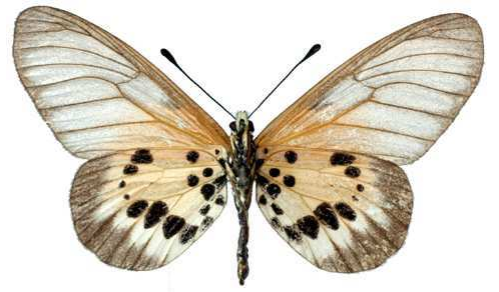
silia, femelle, verso, Tananarive (Madagascar) Vieu 53.JPG silia