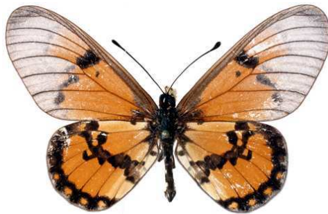
satis, mâle, recto, Chirinda fst, Zimbabwe, 58.JPG satis