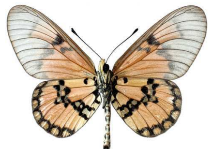
satis, mâle, verso, Jumba ruins, Kenya, 64.JPG satis