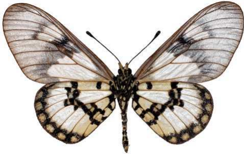
satis femelle, verso, Mafia island (Tanzanie).jpg satis