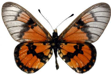
satis, Kenya, Sokoce Bernaud (Cat EB).jpg satis