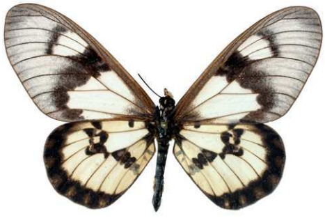
satis, femelle, recto, Kasigan hills, Kenya, 68.JPG