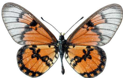
satis, mâle, recto, Kipini, Kenya, 62.JPG satis