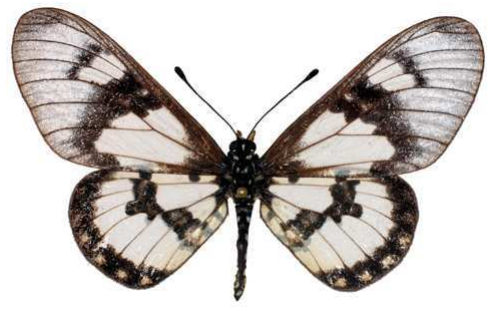
satis femelle, Mafia island (Tanzanie).jpg satis