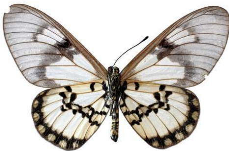
satis, femelle, verso, Shimba hills, Kenya, 67.JPG satis