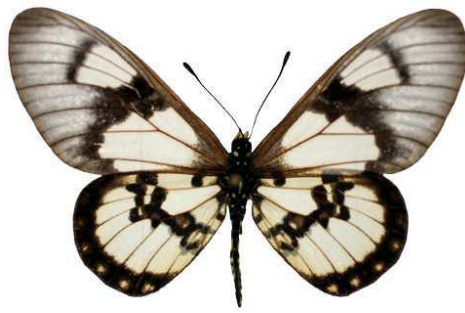
satis, femelle, Tanzanie, Dar-es-Salaam Bernaud (Cat EB).jpg satis