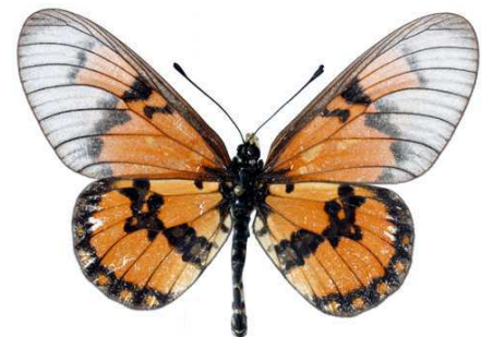
satis, mâle, recto, Jumba ruins, Kenya, 64.JPG satis