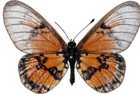
satis mâle, Ubisi - Tucana (Tanzanie).jpg satis