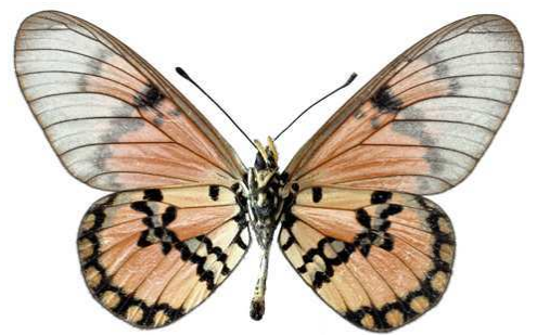
satis, mâle, verso, Kipini, Kenya, 62.JPG satis