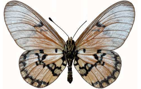
satis mâle, verso, Ubisi - Tucana (Tanzanie).jpg satis