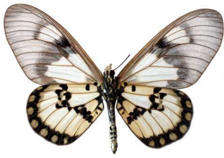
satis, femelle, verso, Kasigan hills, Kenya, 68.JPG satis