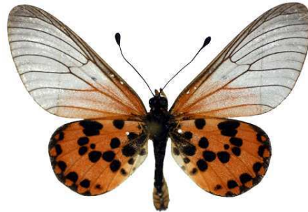
ranavalona, Grande Comore Bernaud (Cat EB).jpg ranavalona