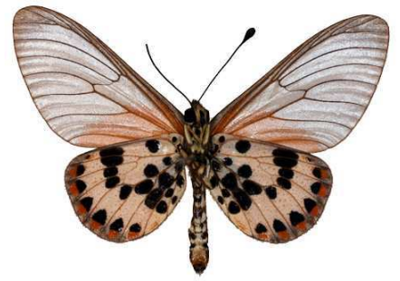
ranavalona mâle, verso, Tananarive (Madagascar).jpg ranavalona