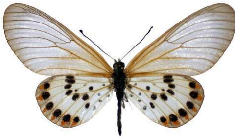
ranavalona, femelle, Antalaha, Madagascar Bernaud (Cat EB).jpg ranavalona