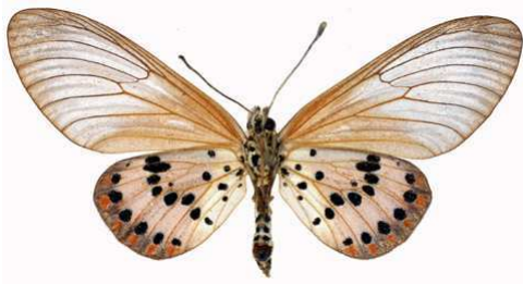
ranavalona femelle, verso (Madagascar).jpg ranavalona