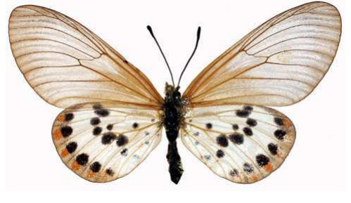
ranavalona femelle, Fianarantsoa (Madagascar).jpg ranavalona