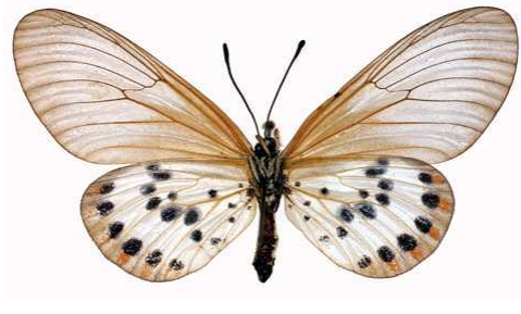
ranavalona femelle, verso, Fianarantsoa (Madagascar).jpg ranavalona