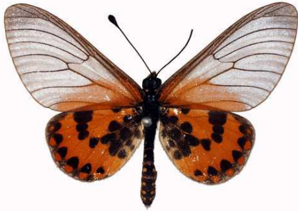
ranavalona mâle, Tananarive (Madagascar).jpg ranavalona