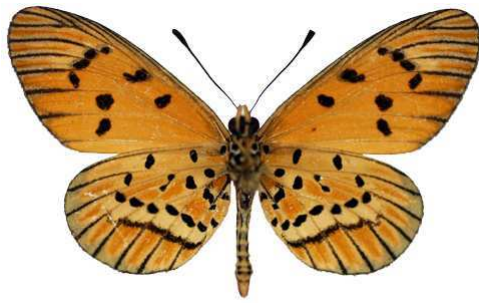
rahirra, verso, Mcllwaine lac, Harare, Zimbabwe MNHN (Cat EB).jpg rahirra