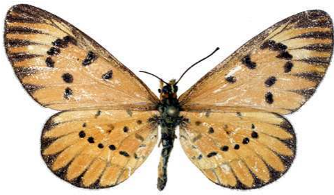
rahirra, femelle, recto, Thyolo, Malawi, 42.JPG rahirra