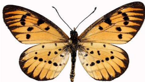
rahirra mâle 2, Lunyangwa swamp - Mzuzu (Malawi) RM.jpg mufindi