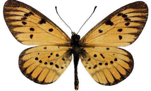
rahira mufindi, Mufindi, Tanzanie MNHN (Cat EB).jpg mufindi