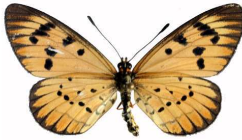
rahira mâle, Mzuzu (Malawi).jpg mufindi