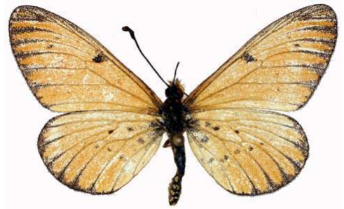
rahira mâle, ab., Luvuyangwa Swamp - Mzuzu (Malawi).jpg mufindi