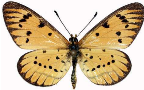
rahira mâle, Luvuyangwa Swamp - Mzuzu (Malawi).jpg mufindi