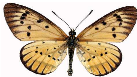
rahirra femelle, Lunyangwa swamp, Mzuzu (Malawi) RM.jpg mufindi