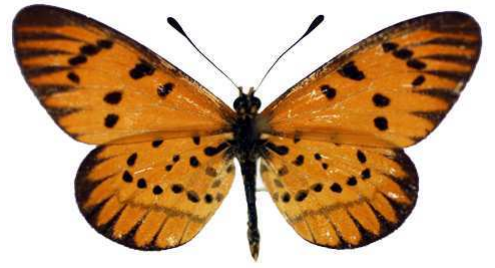
rahirra, Mcllwaine lac, Harare, Zimbabwe MNHN (Cat EB).jpg rahirra