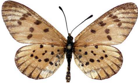
rahirra femelle, Natal (RSA) 2-88 Cat EB Bernaud.jpg rahirra