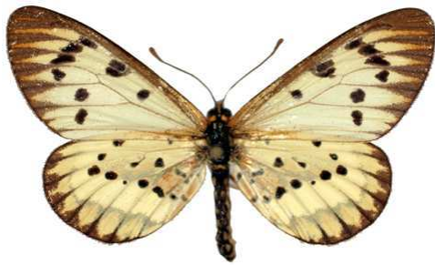
rahirra femelle, Karavia (Zaire) 1-59 Cat EB Bernaud.jpg rahirra