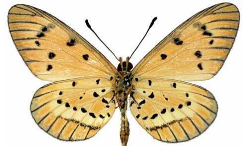
rahira mâle, verso, Luvuyangwa Swamp - Mzuzu (Malawi).jpg mufindi