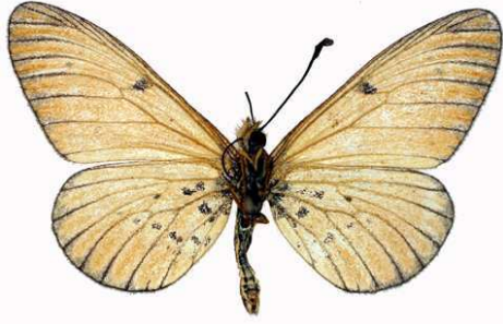
rahira mâle, ab., verso, Luvuyangwa Swamp - Mzuzu (Malawi).jpg mufindi