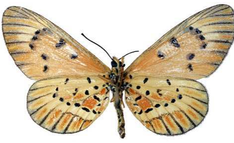
rahirra, femelle, verso, Thyolo, Malawi, 42.JPG rahirra