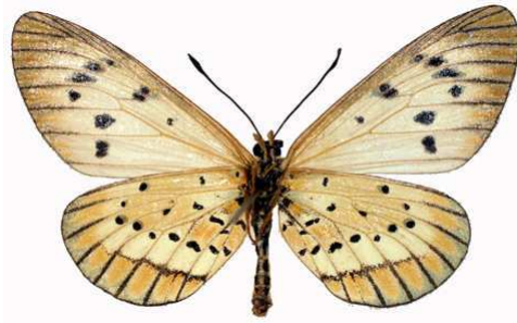
rahira femelle, verso, Luvuyangwa Swamp - Mzuzu (Malawi).jpg mufindi