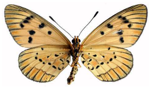
rahirra mâle verso, Mzuzu (Malawi).jpg mufindi