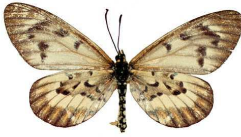
rahirra femelle, Kisantu (Zaire) Coll Shiltze.jpg rahirra