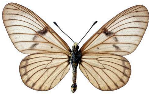
rabbaiae, femelle, verso, Shimba hills, Kenya, 61.JPG rabbaiae