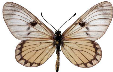
rabbaiae mâle, Shimba hills (Kenya) 4-92 Cat EB Bernaud.jpg rabbaiae