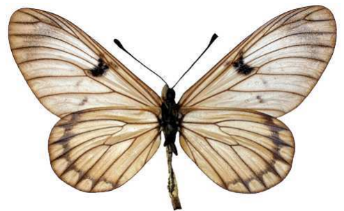
rabbaiae mâle, verso, Shimba hills (Kenya).jpg rabbaiae