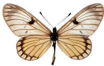
rabbaiae mâle, Shimba hills (Kenya).jpg rabbaiae