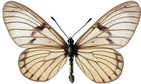
rabbaiae, femelle, recto, Shimba hills, Kenya, 61.JPG rabbaiae