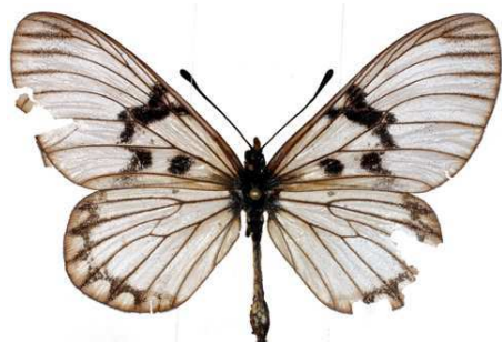
per lucida femelle, Thyolo (Malawi).jpg per lucida