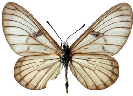
rabbaiae, femelle, verso, Sokoke fst, Kenya, 59.JPG rabbaiae