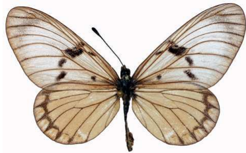
rabbaiae femelle, Sokoke fst (Kenya).jpg rabbaiae