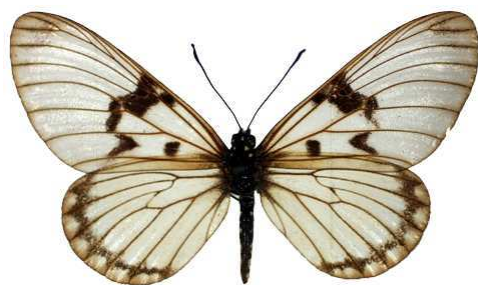
rabbaiae per lucida, Lourenço Marquês, Mozambique MNHN (Cat EB).jpg per lucida