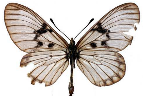
per lucida femelle, verso, Thyolo (Malawi).jpg per lucida