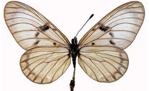
rabbaiae femelle, verso, Sokoke fst (Kenya).jpg rabbaiae