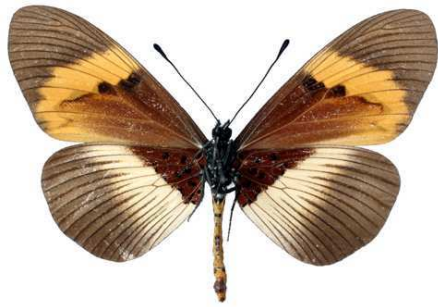
quadricolor, femelle, verso, Bugarama (Burundi) Veronese 57.JPG latifasciata