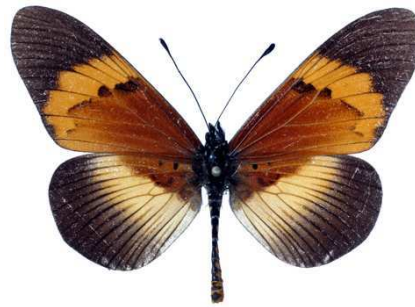
quadricolor, Bugarama (Burundi) Veronese 52.JPG latifasciata