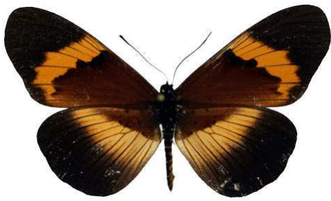
quadricolor latifasciata, femelle, Burundi Bernaud (Cat EB).jpg latifasciata