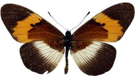
quadricolor 4 (Cat EB).jpg quadricolor