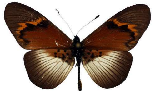
quadricolor quadricolor, Magamba, Tanzanie (Cat EB).jpg leptis