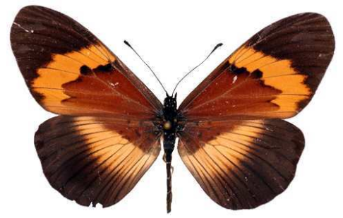
quadricolor femelle, Kadam (Ouganda).jpg latifasciata