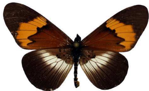
quadricolor 3 (Cat EB).jpg quadricolor