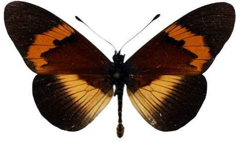
quadricolor latifasciata, Burundi Bernaud (Cat EB).jpg latifasciata