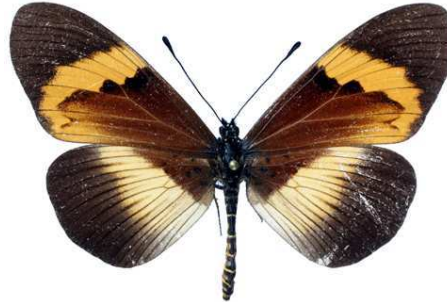
quadricolor, femelle, Bugarama (Burundi) Veronese 57.JPG latifasciata