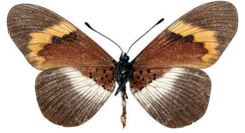
quadricolor, femelle, verso, Lukani - Kilimandjaro (Tanzanie) Kielland 61.JPG quadricolor