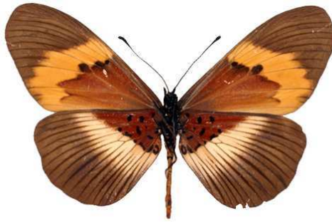
quadricolor femelle verso, Kadam (Ouganda).jpg latifasciata