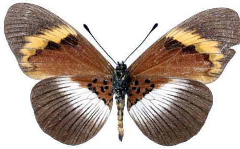
quadricolor, femelle, verso, Lukari - Kilimandjaro (Tanzanie) Kielland 61.JPG quadricolor