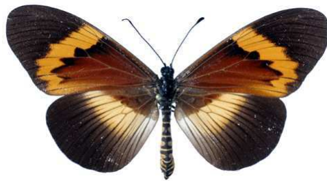
quadricolor, femelle, Kakamega fst (Kenya) 70.JPG quadricolor