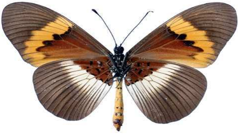
quadricolor, femelle, verso, Kakamega fst (Kenya) 70.JPG quadricolor