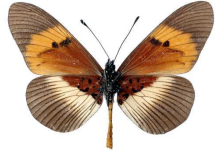
quadricolor, verso, Bugarama (Burundi) Veronese 52.JPG latifasciata