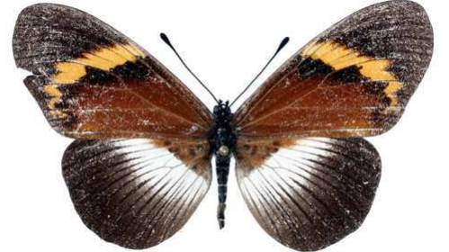
quadricolor, femelle, Lukari - Kilimandjaro (Tanzanie) Kielland 61.JPG quadricolor