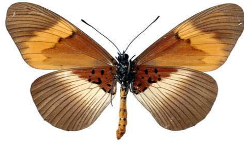
quadricolor, femelle, verso, Kakamega fst (Kenya) 64.JPG quadricolor