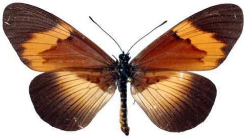
quadricolor, femelle, Kakamega fst (Kenya) 64.JPG quadricolor