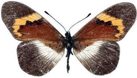
quadricolor, femelle, Lukani - Kilimandjaro (Tanzanie) Kielland 61.JPG quadricolor