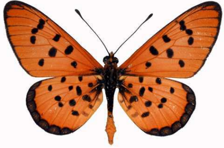
punctellata mâle, Kasitu rock (Malawi) RM.jpg punctellata