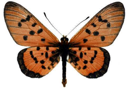
punctellata, Phalombe, Malawi MNHN (Cat EB).jpg punctellata