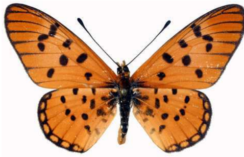
punctellata mâle, Kapanga (R.D. Congo).JPG punctellata