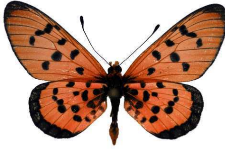
punctellata mâle, Fort Lister (Malawi).jpg punctellata