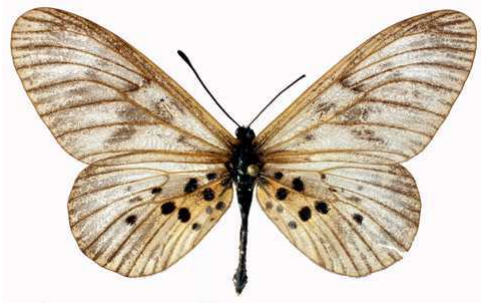
polis mâle, Banco (RCI).jpg polis