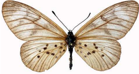
polis femelle, Kibi (Ghana).jpg polis