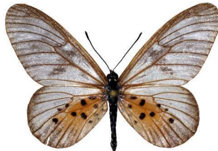
polis mâle (Sierra Leone) 7-81 Cat EB Bernaud.jpg polis