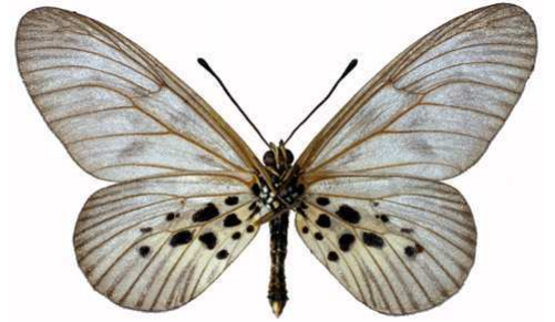
polis mâle verso, Mt Cameroun (Cameroun).jpg polis