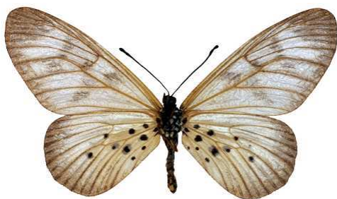
polis femelle, verso, Omo fst (Nigeria).jpg polis