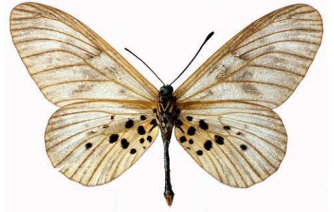
polis mâle verso, Banco (RCI).jpg polis