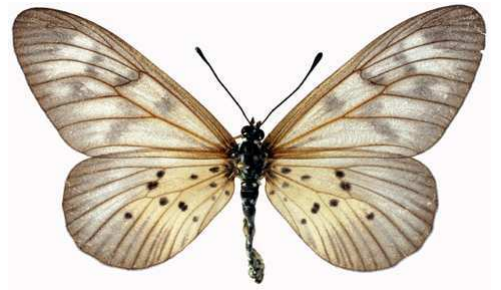
polis femelle, Mt Cameroun (Cameroun).jpg polis