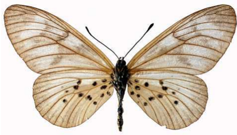
polis femelle verso, Kibi (Ghana).jpg polis