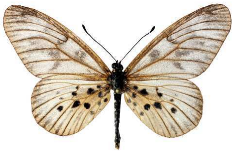
polis mâle, Kibi (Ghana).jpg polis