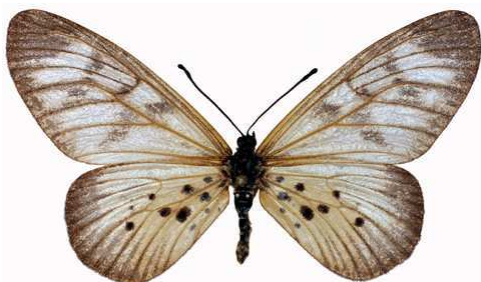
polis femelle, Omo fst (Nigeria).jpg polis