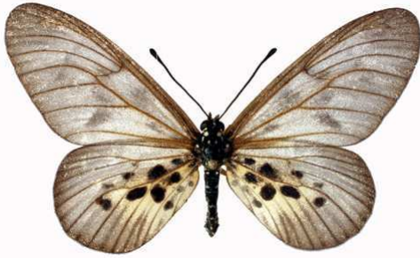
polis mâle, Mt Cameroun (Cameroun).jpg polis