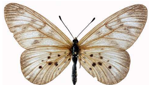
polis femelle, Banco (RCI).jpg polis