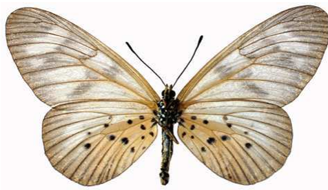
polis femelle verso, Limbe (Cameroun).jpg polis