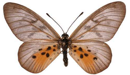
polis mâle, Cameroun Mt (Cameroun) 5-91 Cat EB Bernaud.jpg polis