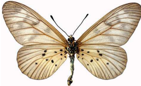
polis femelle verso, Mt Cameroun (Cameroun).jpg polis