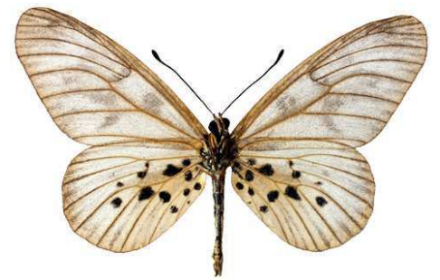
polis mâle verso, Kibi (Ghana).jpg polis