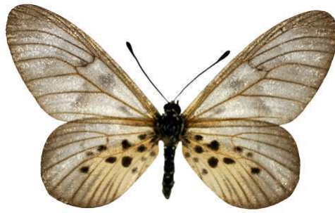
polis, mt Cameroun Bernaud (Cat EB).jpg polis