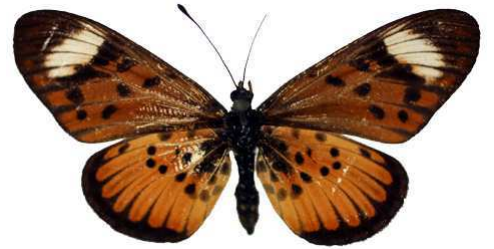
petraea femelle 2 (Cat EB).jpg petraea