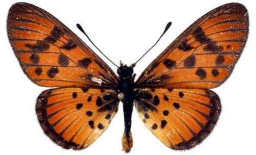
petraea mâle, Dar-es-Salam (Tanzanie).JPG petraea