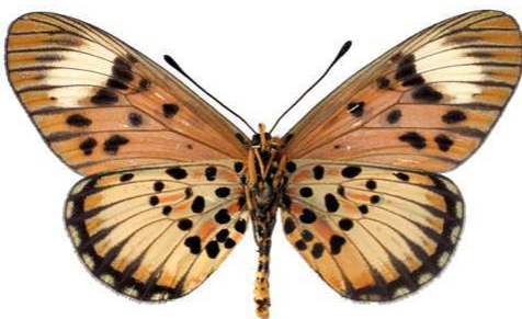
petraea femelle, verso, Durban (RSA).JPG petraea