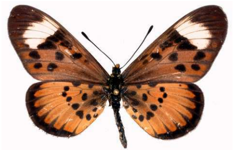
petraea femelle, Durban (RSA).jpg petraea