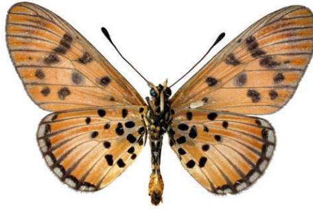
petraea mâle, verso, Dar-es-Salam (Tanzanie).JPG petraea