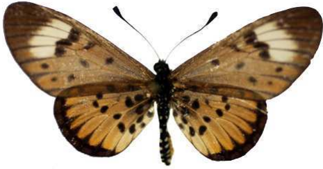
petraea femelle 1 (Cat EB).jpg petraea