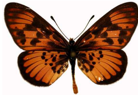
petraea mâle, Durban (RSA).jpg petraea