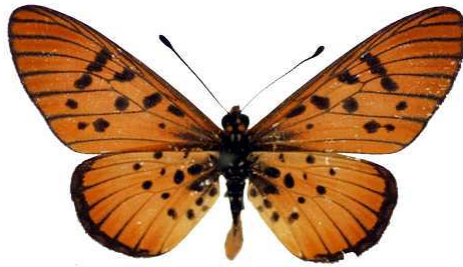
petraea mâle 1 (Cat EB).jpg petrina