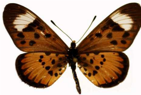
petraea femelle 2, Durban (RSA).jpg petraea