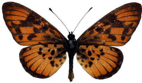
petraea mâle 2 (Cat EB).jpg petraea