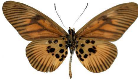
orinata, verso, Mbalmayo, Cameroun MNHN (Cat EB).jpg orinata