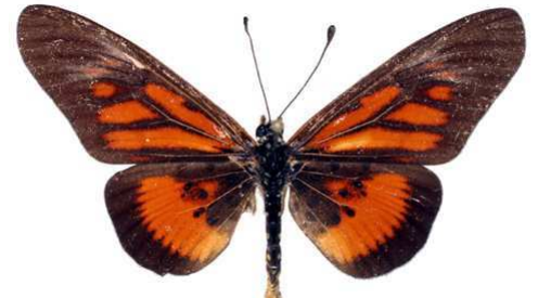
orinata femelle, Maluku (R. D. Congo).jpg orinata