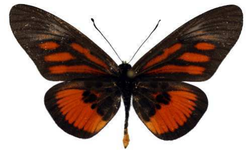
orinata, Mawokota, Ouganda Bernaud (Cat EB).jpg orinata