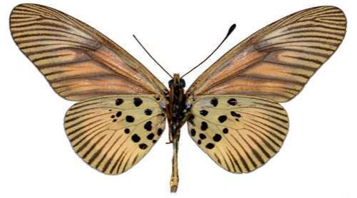
orinata femelle verso, Ebogo (Cameroun).jpg orinata