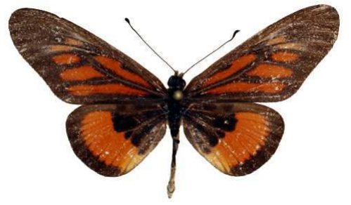
orinata mâle, Mpigi - Mawokota (Ouganda).jpg orinata