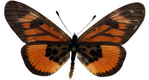
orinata, femelle, Entebbe, Ouganda Bernaud (Cat EB).jpg orinata