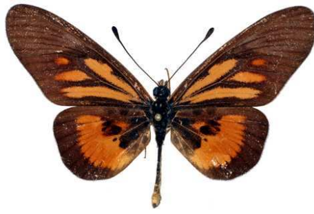
orinata mâle, Ebogo (Cameroun).jpg orinata