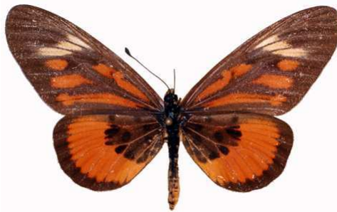
orinata femelle 2, Ssesse (Ouganda).jpg orinata