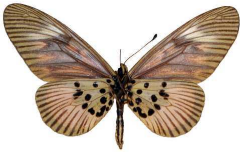
orinata femelle 2 verso, Ssesse (Ouganda).jpg orinata