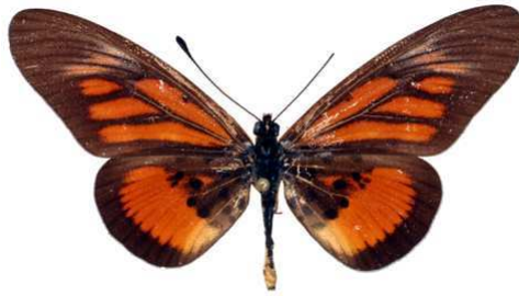
orinata femelle, Ebogo (Cameroun).jpg orinata