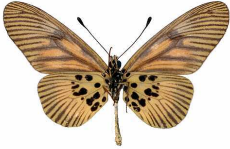
orinata mâle verso, Ebogo (Cameroun).jpg orinata