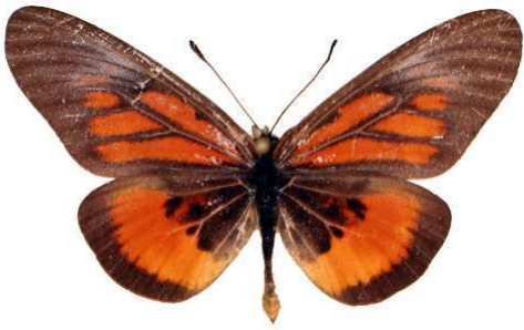
orinata mâle, Katera forest (Ouganda).jpg orinata