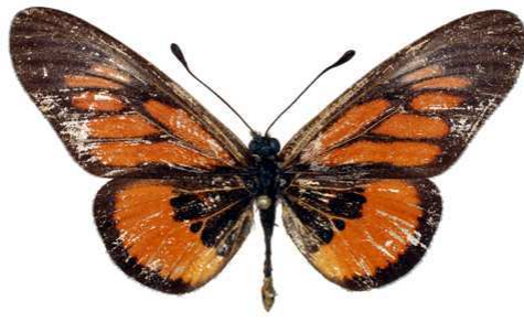
orinata mâle (Tanzanie).jpg orinata