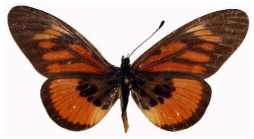
orinata femelle 3, Ssesse (Ouganda) .jpg orinata