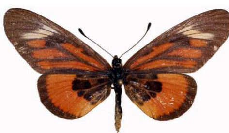
orinata femelle, Ssesse (Ouganda).jpg orinata