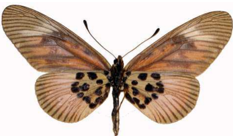
orinata femelle verso, Ssesse (Ouganda).jpg orinata