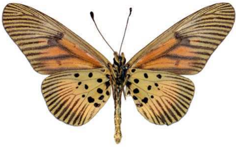
orinata femelle verso, Maluku (R. D. Congo).jpg orinata