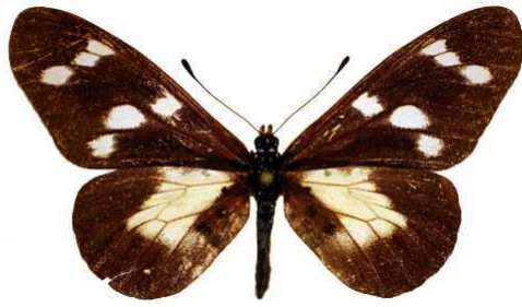
oreas oboti femelle, Batchingou mount (Cameroun).jpg oboti