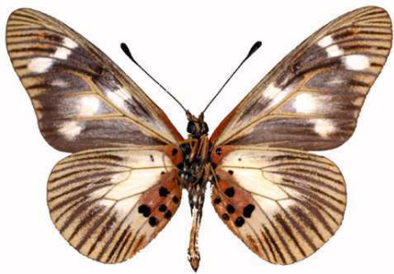
oreas mâle verso, Kadam mount (Ouganda).jpg oreas