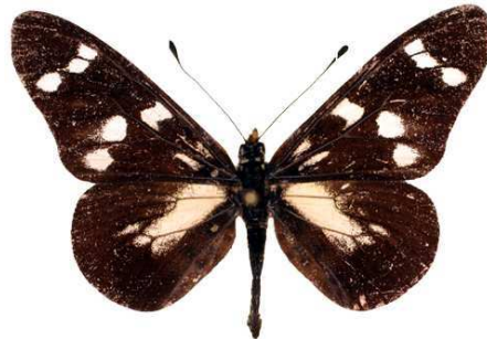
oreas mâle 2, Kadam mount (Ouganda).jpg albimaculata