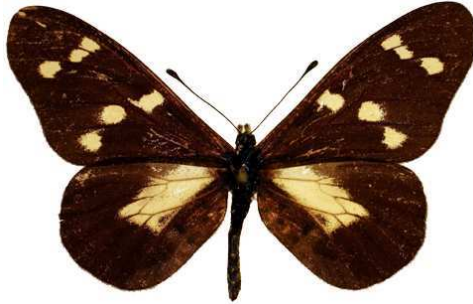
oreas femelle, Mihunga.jpg oreas