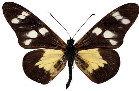
oreas, forme angolanus, Bihé, Angola MNHN (Cat EB).jpg angolanus