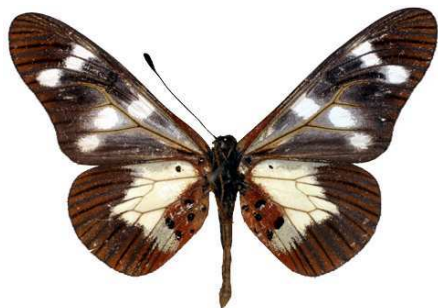
oboti mâle, verso, Ngel Nyaki (Nigeria).jpg oboti