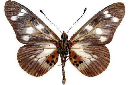
oreas mâle verso 2, Kadam mount (Ouganda).jpg oreas