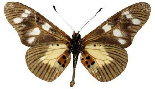
oreas, forme angolanus, verso, Angola MNHN (Cat EB).jpg angolanus