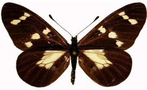
oreas femelle, Kirivata (Zaire).jpg oreas