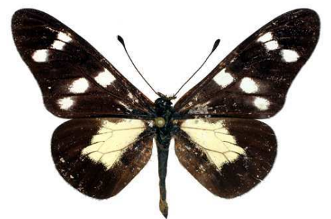
oboti mâle, Ngel Nyaki (Nigeria).jpg oboti