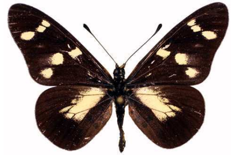
oreas mâle, Kadam mount (Ouganda).jpg oreas