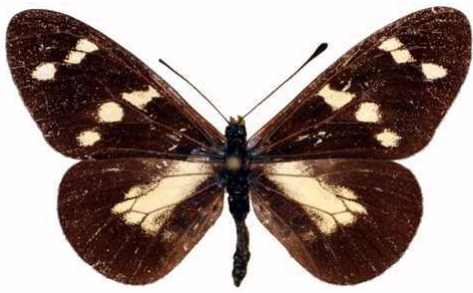
oreas femelle, Kadam mount (Ouganda).jpg oreas