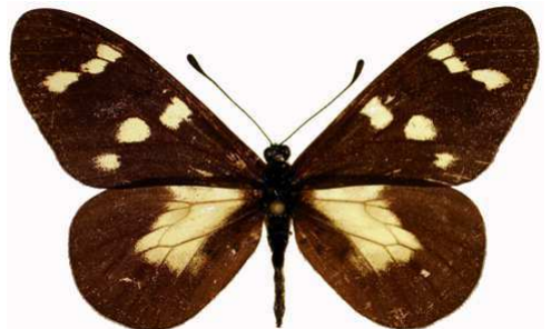
oreas femelle, Rusarenda (Burundi).jpg oreas