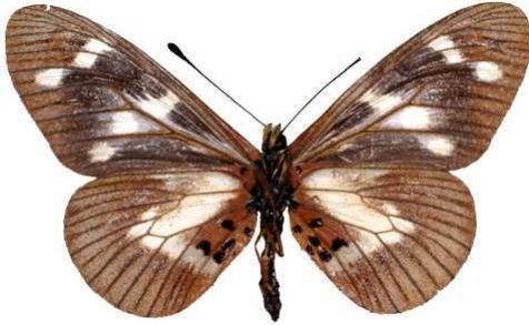
oreas femelle verso, Kadam mount (Ouganda).jpg oreas