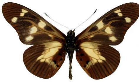
oreas, verso, Lufira, lac Kivu, RD Congo MNHN (Cat EB).jpg oreas