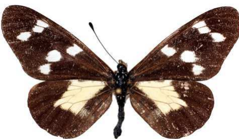
oreas oboti femelle, Batchingou (Cameroun) 12-93 Cat EB Bernaud.jpg oboti