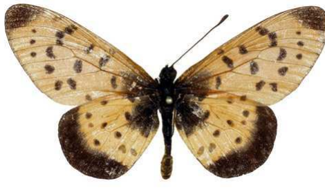
omrora umbraetae, femelle, recto, Lac Bangweolo - Luwingu, R.D. Congo, 49.JPG umbraetae