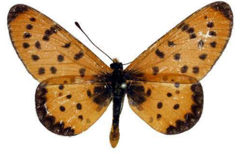
omrora umbraetae, mâle, recto, Mulando - Katanga, R.D. Congo, 44.JPG umbraetae