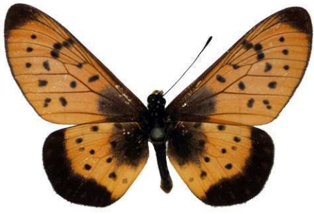
omrora umbraetae, Abercorn, Zambie MNHN (Cat EB).jpg omrora