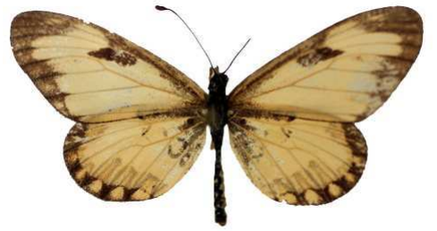
ochrascens, Ruanda MNHN (Cat EB).jpg ochrascens