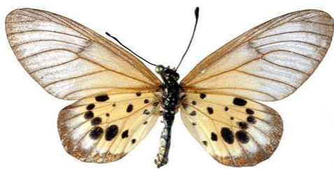
obeira femelle, Tanantave (Madagascar).jpg obeira