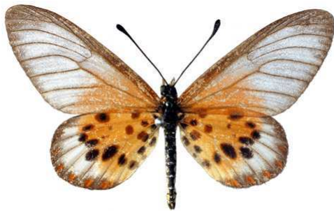
obeira mâle 2, Tananarive (Madagascar).jpg obeira