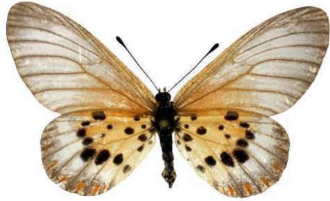
obeira, femelle, Tananarive, Madagascar Bernaud (Cat EB).jpg obeira