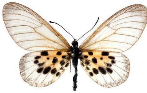
obeira, femelle, Tananarive (Madagascar) Turlin 52.JPG obeira