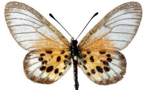
obeira mâle, Tananarive (Madagascar).jpg obeira