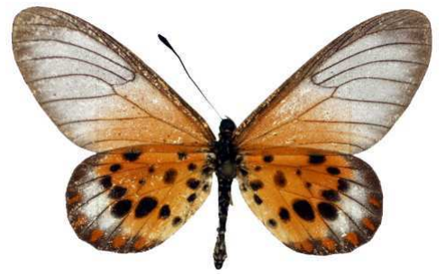
obeira, Tananarive, Madagascar Bernaud (Cat EB).jpg obeira