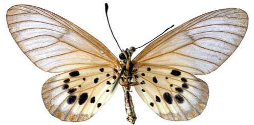
obeira femelle verso, Tanantave (Madagascar).jpg obeira