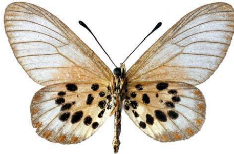
obeira mâle verso, Tananarive (Madagascar).jpg obeira