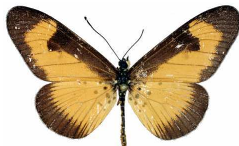
alciopie mâle, Isheri fst (Nigeria).jpg alciopie