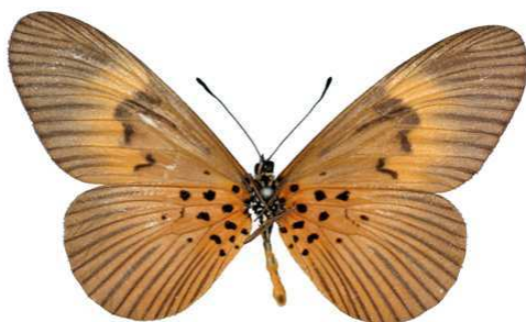
alciopie femelle verso, Douala (Cameroun) 10-89 Cat EB Bernaud.jpg alciopie