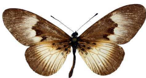
alciopie, femelle blanche, Toumodi, Côte d'ivoire MNHN (Cat EB).jpg alciopie