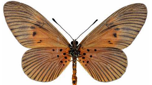
alciops femelle verso, Mt Cameroun (Cameroun).jpg fumida