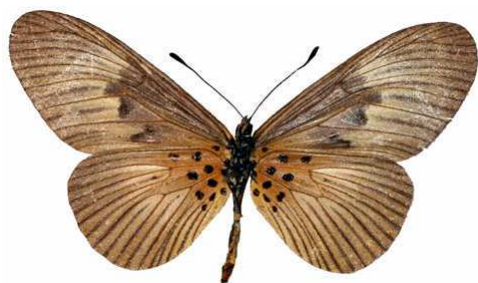
alciopie femelle verso, South (Ghana).jpg alciopie