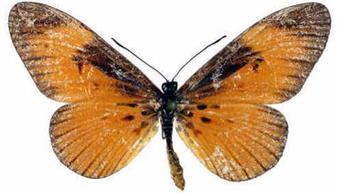
alciops femelle, Tombokro (RCI).jpg alciops