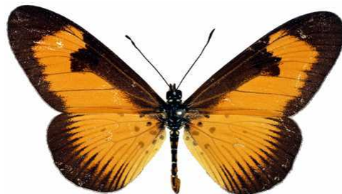
alciopie mâle, Douala (Cameroun).jpg alciopie