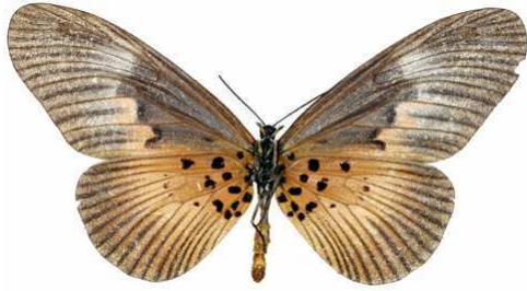
alciops femelle 2 verso, Tombokro (RCI).jpg alciops