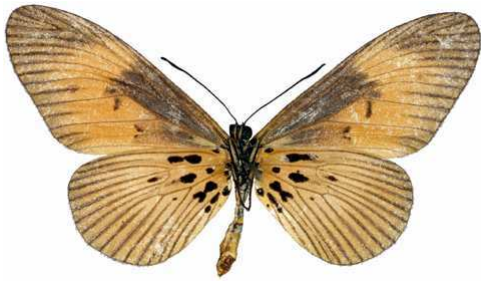
alciops femelle verso, Tombokro (RCI).jpg alciops