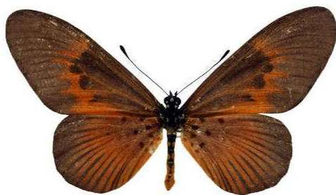
alciopie, femelle, Mt Cameroun Bernaud (Cat EB).jpg fumida