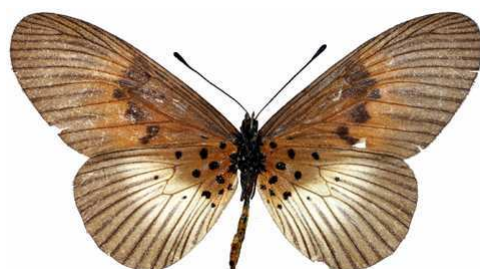
alciopie femelle verso, Boabeng (Ghana).jpg alciopie