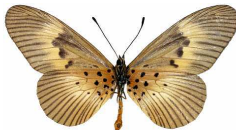
alciopie femelle verso, Douala (Cameroun).jpg alciopie