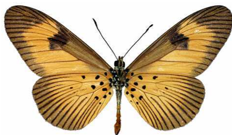
alciopie mâle verso, Douala (Cameroun).jpg alciopie