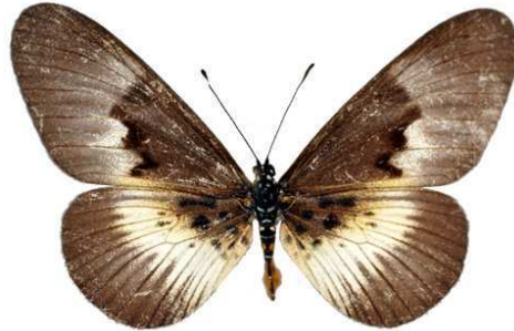
alciops femelle, Kibi (Ghana) Cat EB Bernaud.jpg alciops