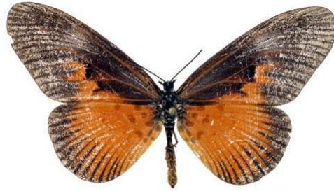
alciops femelle 2, Tombokro (RCI).jpg alciops