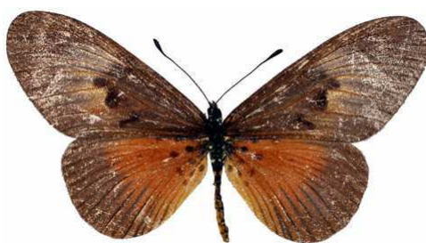
alciopie femelle, South (Ghana).jpg alciopie