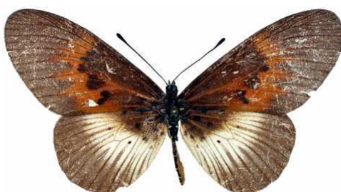
alciopie femelle, Boabeng (Ghana).jpg alciopie