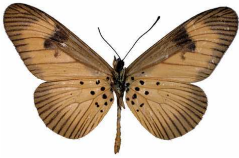
alciops mâle, verso, Isheri fst (Nigeria).jpg alciops