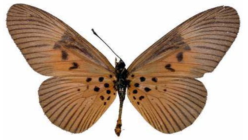
alciops femelle, verso, Isheri fst (Nigeria).jpg fumida