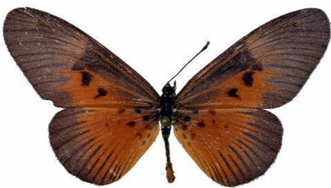
alciops femelle, Isheri fst (Nigeria).jpg fumida