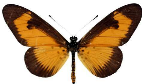
alciopie, Mt Cameroun Bernaud (Cat EB).jpg alciopie