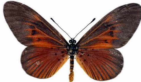
alciops femelle, Mt Cameroun (Cameroun).jpg fumida