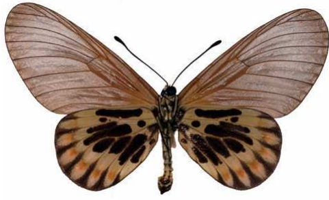
admatha femelle, ab., verso, Massok - Douala (Cameroun).jpg admatha