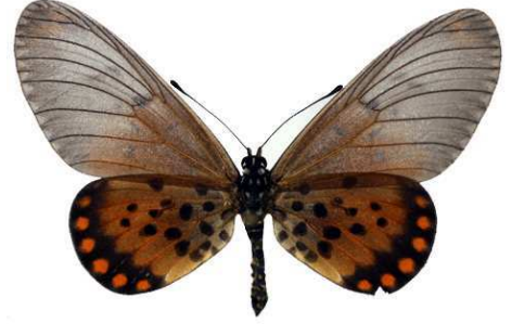
admatha, femelle, Cameroun, Douala Bernaud (Cat EB).jpg admatha