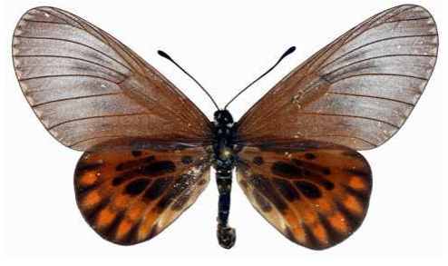
admatha femelle, ab., Massok - Douala (Cameroun).jpg admatha