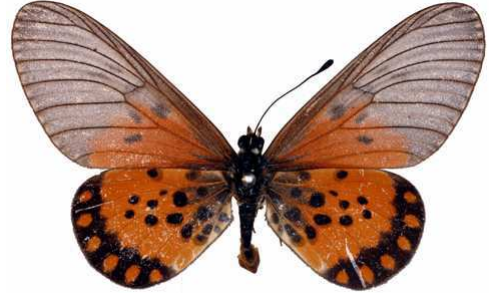
admatha mâle, Ilaro fst (Nigeria).jpg admatha