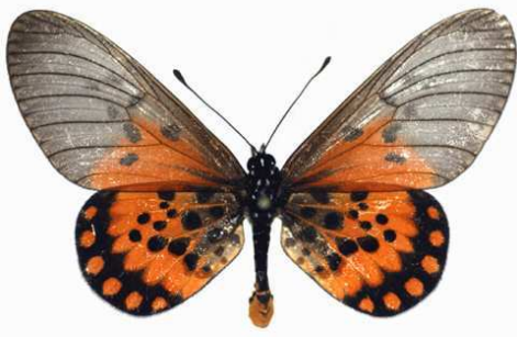
admatha mâle 01 Douala (Cameroun).jpg admatha