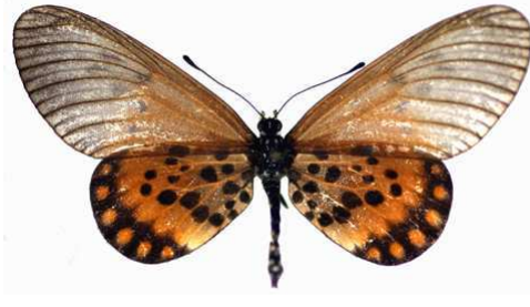
admatha femelle 01 Makokou (Gabon).jpg admatha