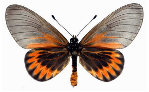
admatha mâle ab Douala (Cameroun).jpg admatha