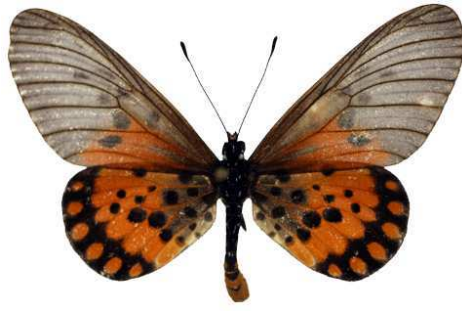
admatha, Cameroun, Douala Bernaud (Cat EB).jpg admatha