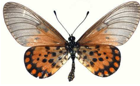
admatha femelle 01 Douala (Cameroun).jpg admatha