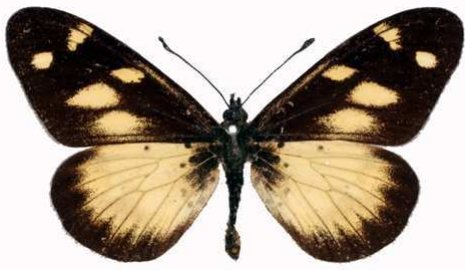
acuta mâle, Juniper fst - Nyika (Malawi) RM.jpg acuta