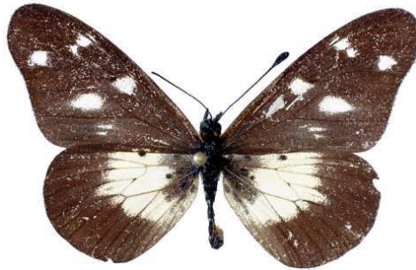
acuta, mâle, recto, Nguru mts, Tanzanie, 40.JPG acuta