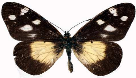
acuta femelle, Mughese (Malawi) RM.jpg acuta