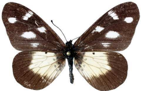
acuta, femelle, recto, Nguru mts, Tanzanie, 48.JPG acuta