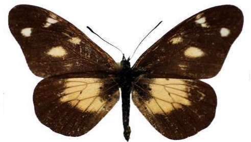
acuta, Rubeho mt, Tanzanie MNHN (Cat EB).jpg acuta