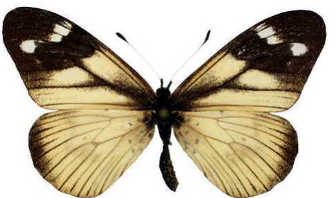
acuta, femelle, Rugeho ft, Bufumira, Tanzanie Bernaud (Cat EB).jpg acuta