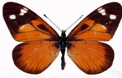
acuta femelle, Misuku hills (Malawi) RM.jpg rubrobasalis