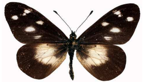
acuta mâle, Mughese (Malawi) RM.jpg acuta