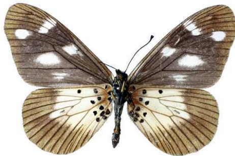
acuta, femelle, verso, Nguru mts, Tanzanie, 48.JPG acuta