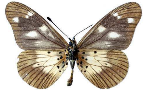
acuta, mâle, verso, Nguru mts, Tanzanie, 40.JPG acuta