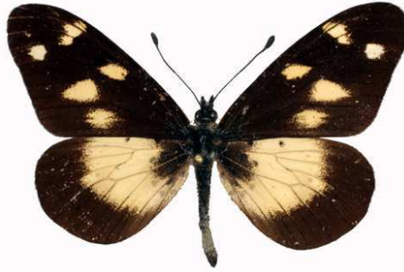
acuta mâle 2, Mughese (Malawi) RM.jpg acuta