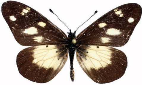
acuta mâle, Mughese (Malawi).jpg acuta