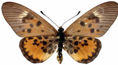
abdera femelle, Vaku - Mayombe (R.D. Congo).JPG abdera