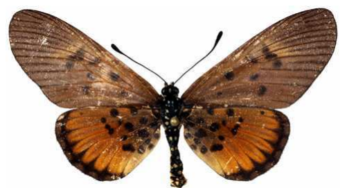
abdera femelle, Sangba (RCA).JPG abdera