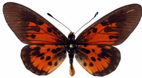
abdera mâle ab., Sangba (RCA).JPG abdera