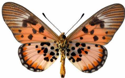
abdera mâle, verso, Sangba (RCA).JPG abdera