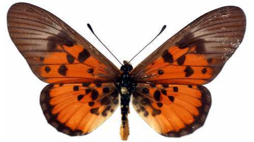
abdera mâle, Sangba (RCA).JPG abdera