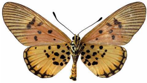
abdera femelle, verso, Sangba (RCA).JPG