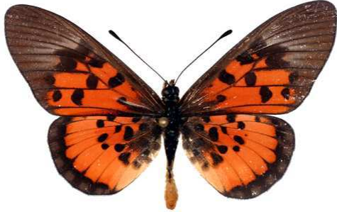
abdera mâle, Metu hills (Ouganda).jpg abdera