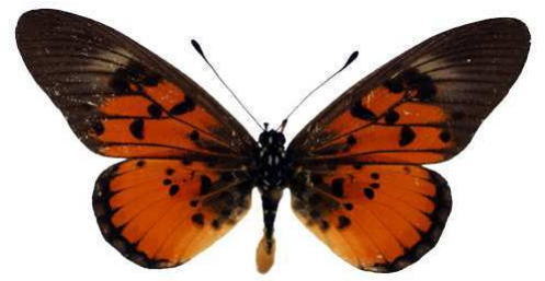
abdera abdera, mt Batcha, Cameroun Bernaud (Cat EB).jpg abdera