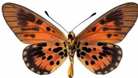
abdera mâle ab., verso, Sangba (RCA).JPG abdera