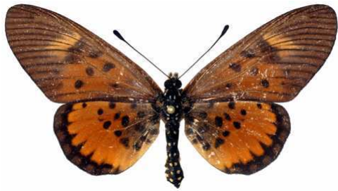
abdera femelle, Mt Bana (Cameroun).JPG abdera