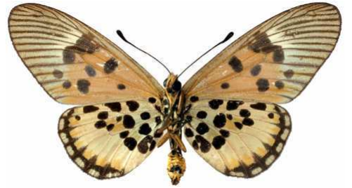
abdera femelle, verso, Vaku - Mayombe (R.D. Congo).JPG abdera