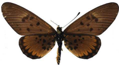
abdera abdera, femelle, riv Bamingui, Ndélé, RCA Bernaud (Cat EB).jpg abdera