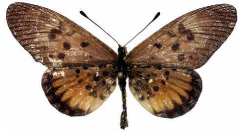
abdera femelle, Metu hills (Ouganda).jpg abdera