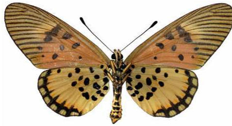
abdera femelle, verso, Mt Bana (Cameroun).JPG abdera