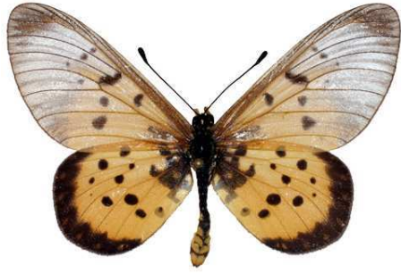
matuapa mâle, Sokoke fst (Kenya).jpg matuapa