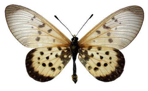
matuapa, femelle, Sokoke ft, KenyaMNH (Cat EB).jpg matuapa