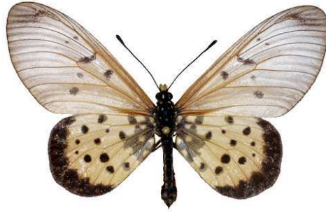
matuapa femelle, Sokoke fst (Kenya).jpg matuapa