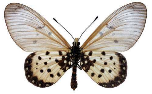
matuapa femelle, verso, Sokoke fst (Kenya).jpg matuapa