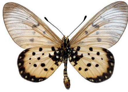
matuapa mâle, verso, Sokoke fst (Kenya).jpg matuapa