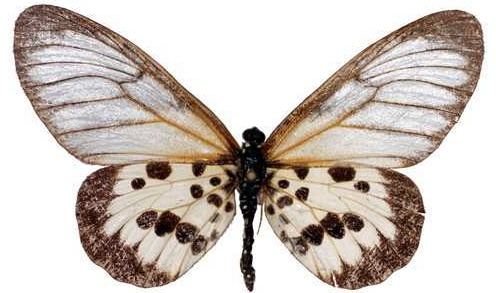
masamba femelle f jaune, Sambava (Madagascar) 9-74 Cat EB Bernaud.jpg masamba