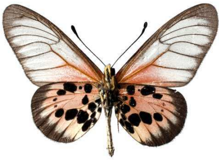
masamba, verso, Sambava (Madagascar) Turlin 41.JPG masamba