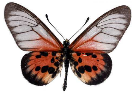
masamba, Sambava (Madagascar) Turlin 41.JPG masamba