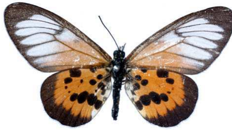
Masamba, femelle, Tananarive (Madagascar) 46.JPG masamba