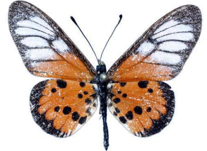
Masamba, Antsahabe - Ambatesina rd (Madagascar) 37.JPG masamba