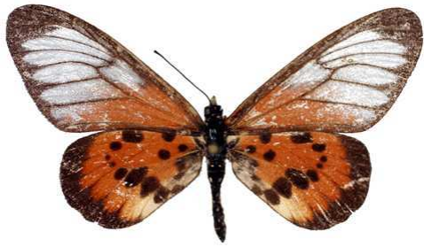
masamba femelle (Madagascar) Cat EB Bernaud.jpg masamba