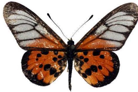
masamba, Tananarive, Madagascar MNHN (Cat EB).jpg masamba