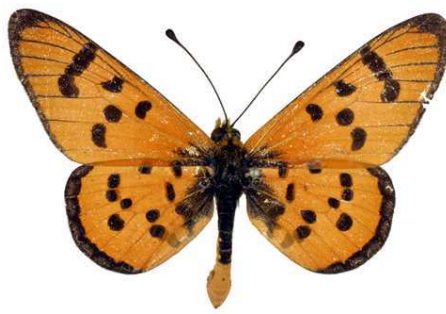
mansya janssensi, mâle, recto, paratype, Katentania, R.D. Congo, 44.JPG mansya