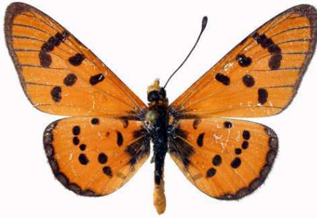
mansya mâle, Kapiri (R.D. Congo).JPG mansya