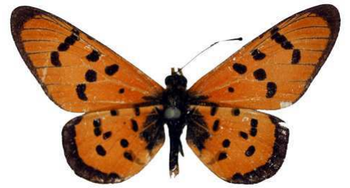
mansya, Mukana, PNO, RD Congo MNHN (Cat EB).jpg mansya