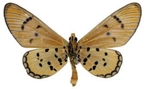
mansya janssensi, femelle, verso, paratype, R. Dumbo Dilolo - Katanga, R.D. Congo, 32.JPG mansya