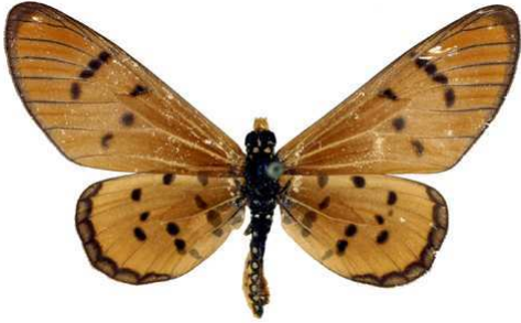
mansya janssensi, femelle, recto, paratype, R. Dumbo Dilolo - Katanga, R.D. Congo, 32.JPG mansya