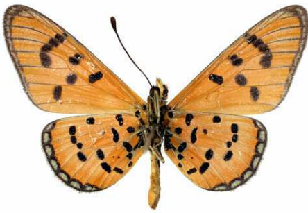
mansya mâle, verso, Kapiri (R.D. Congo).JPG mansya