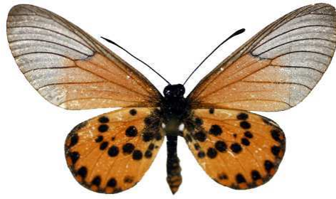
machequena, Pemba, Cabo Delgado, Mozambique MNHN (Cat EB).jpg machequena