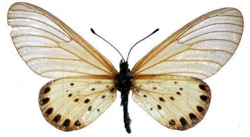
machequena, femelle, Port Amelia, Malawi MNHN (Cat EB).jpg machequena