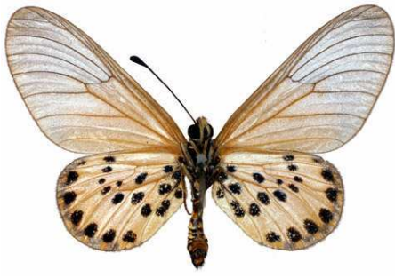
machequena mâle, verso, Vumba (Zimbabwe).jpg machequena