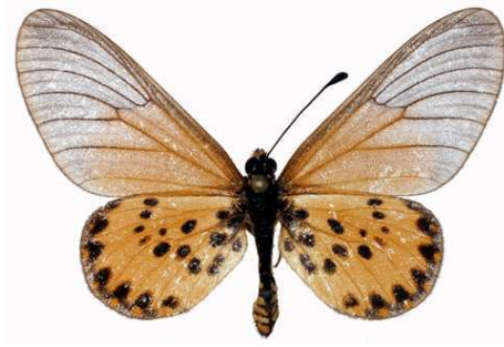
machequena mâle, Vumba (Zimbabwe).jpg machequena