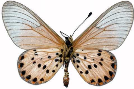
machequena mâle verso, SE - bord du lac Malawi (Tanzanie).jpg machequena