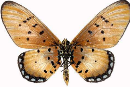
lygus femelle, verso, Johannesburg (RSA).jpg lygus