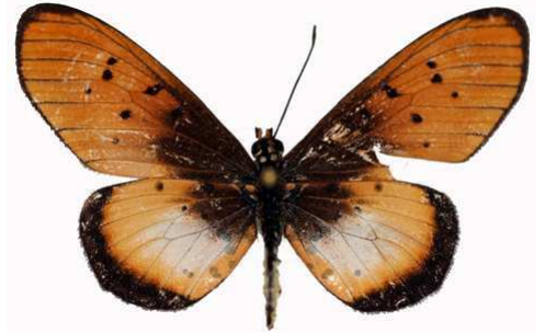
lygus femelle, Katanga (Zaire) Vingerhoedt.jpg lygus