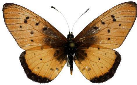
lygus mâle 1 (Cat EB).jpg lygus