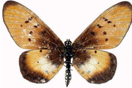
lygus femelle, Johannesburg (RSA).jpg lygus