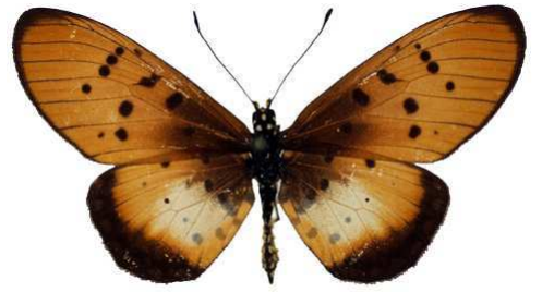
lygus femelle (Cat EB).jpg lygus