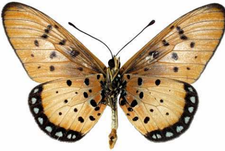
lygus mâle, verso, Sepopa (Botswana).jpg lygus