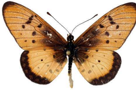
lygus mâle, Sepopa (Botswana).jpg lygus