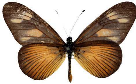
lycoa, Limbe, Cameroun Bernaud (Cat EB).jpg media