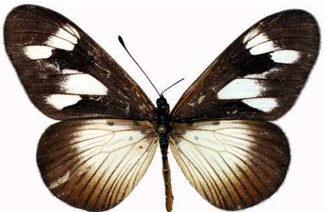
lycoa femelle, Bobiri (Ghana).jpg lycoa