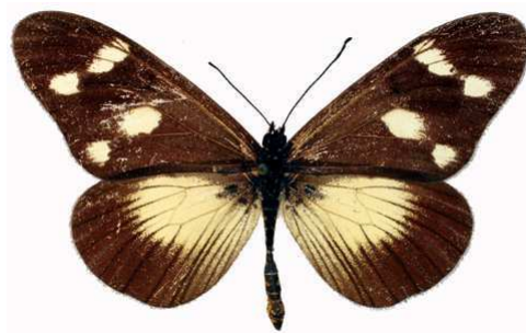
lycoa mâle, Moschi - Kilimandjaro (Tanzanie).jpg fallax