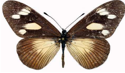
lycoa femelle, Principe (Sao Tomé).jpg media