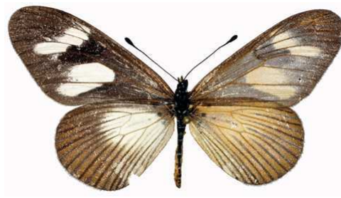
lycoa (RCA).jpg lycoa