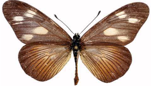
lycoa mâle, Kalinzu (Ouganda).jpg media