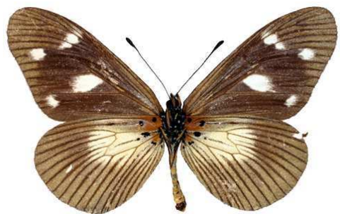
lycoa femelle verso, Kilimandjaro (Tanzanie).jpg fallax