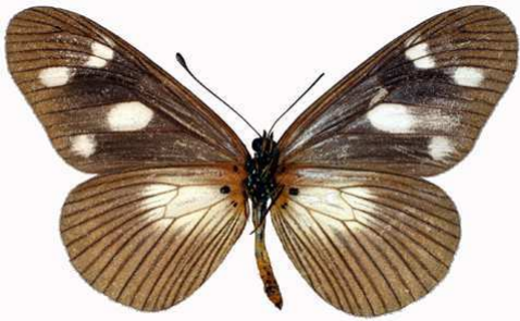
lycoa femelle verso, Kakamega fst (Kenya).jpg tirika