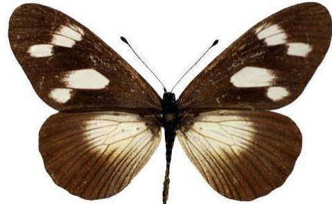
lycoa, femelle, Malabo, mt Pico Bernaud (Cat EB).jpg media