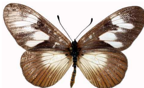
lycoa femelle, Yatimbo (RCA).jpg lycoa