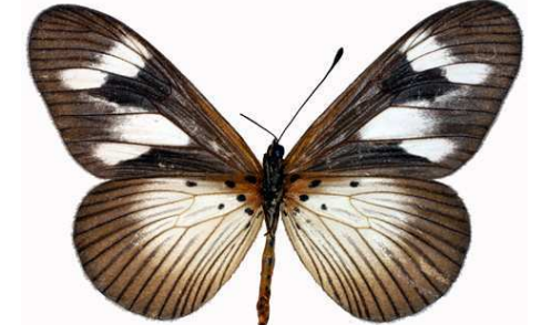
lycoa femelle verso, Bobiri (Ghana).jpg lycoa