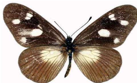
lycoa femelle, Kakamega fst (Kenya).jpg tirika