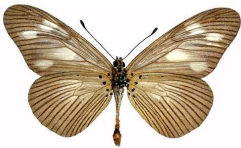
lycoa mâle verso, Kalinzu (Ouganda).jpg media