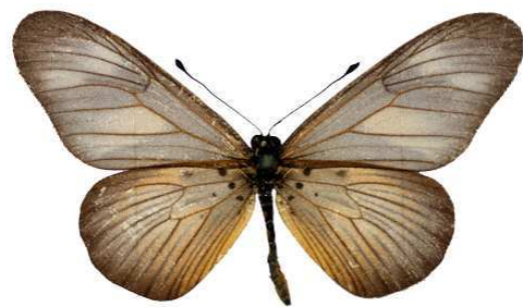
lycoa, Sierra Leone MNHN (Cat EB).jpg lycoa