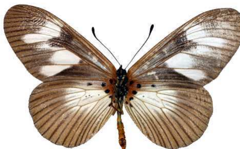
lycoa femelle verso, Yatimbo (RCA).jpg lycoa