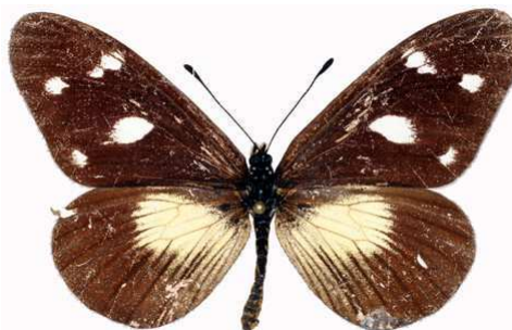
lycoa femelle, Kilimandjaro (Tanzanie).jpg fallax