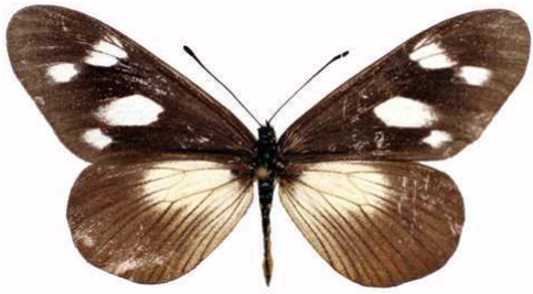
lycoa femelle, Mawokota (Ouganda).jpg entebbia