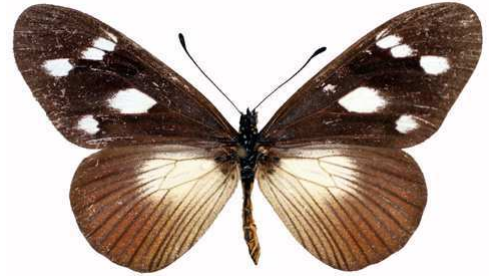
lycoa femelle 2, Mawokota (Ouganda).jpg entebbia