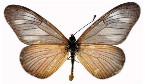
lycoa mâle, Sapoba (Nigeria).jpg lycoa