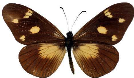
lycoa, forme aequalis, Kebré-Mengist, Ethiopie MNHN (Cat EB).jpg aequalis