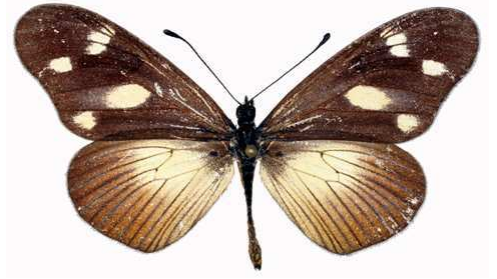
lycoa mâle, Sotik - Chepalungu fst (Kenya).jpg tirika