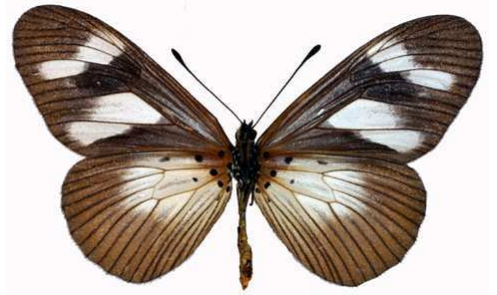
lycoa femelle verso, Mt Pico - Malabo (Guinée Equatoriale).jpg lycoa