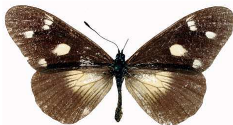
lycoa femelle aequalis, Ouama (Ethiopie).jpg aequalis