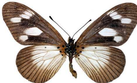
lycoa femelle, verso, Sapoba (Nigeria).jpg lycoa