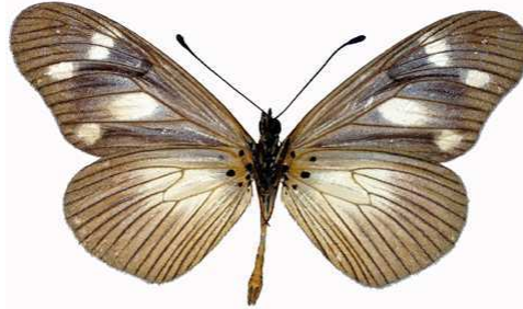
lycoa mâle verso, Sotik - Chepalungu fst (Kenya).jpg tirika