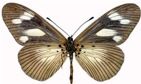
lycoa femelle verso, Principe (Sao Tomé).jpg media