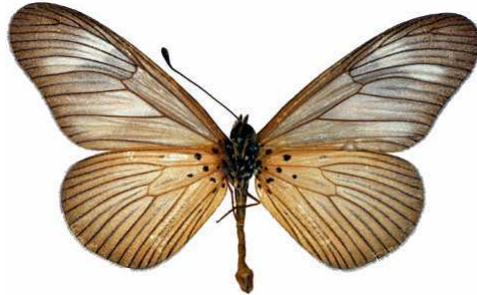
lycoa mâle, verso, Sapoba (Nigeria).jpg lycoa