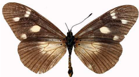
lycoa femelle aequalis verso, Ouama (Ethiopie).jpg aequalis