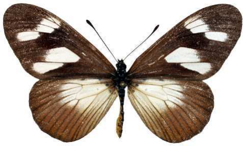
lycoa femelle, Mt Pico - Malabo (Guinée Equatoriale).jpg lycoa