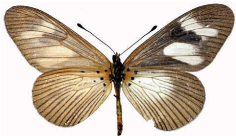
lycoa verso (RCA).jpg lycoa