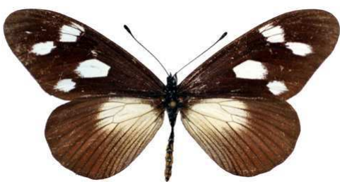
lycoa femelle, Tanzanie 2-95 Cat EB Bernaud.jpg fallax