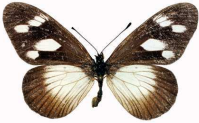
lycoa femelle, Sapoba (Nigeria).jpg lycoa