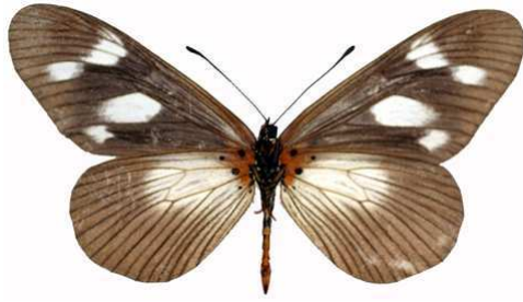
lycoa femelle verso, Mawokota (Ouganda).jpg entebbia