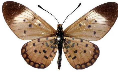
lualabae femelle, Lusinga (R.D. Congo).jpg