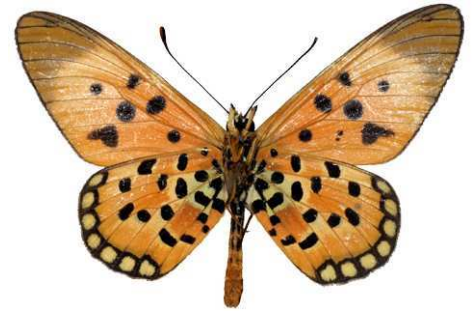
lualabae mâle, verso, Kamitungulu (R.D. Congo).jpg