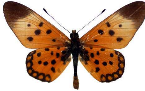
lualabae, Dembo-Dilolo, Katanga, RD Congo MNHN (Cat EB).jpg