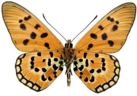
loranae, mâle, verso, paratype, Marungu plateau, R.D. Congo, 54.JPG