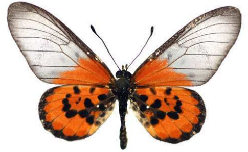
lia, Pamandzi, Mayotte Bernaud (Cat EB).jpg