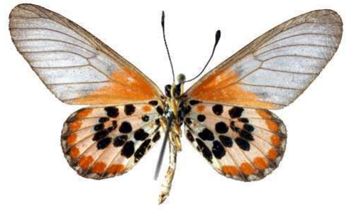
lia mâle verso, Tamatave (Madagascar).jpg