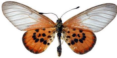
lia femelle, Tanandave (Madagascar).jpg