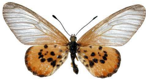
lia femelle, Mayotte 8-83 Cat EB Bernaud.jpg