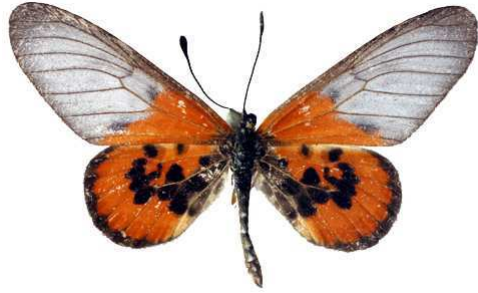
lia mâle, Tamatave (Madagascar).jpg