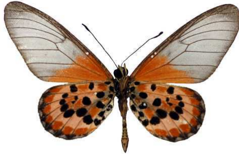
lia, verso, Pamandzi, Mayotte MNHN (Cat EB).jpg