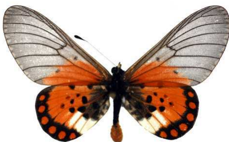
leucographa, Tanzanie (Kielland) MNHN (Cat EB).jpg leucographa