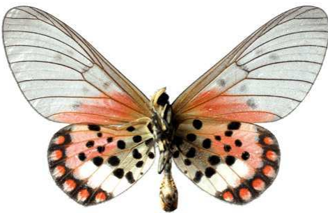
leucographa, verso, Kakamega fst (Kenya) 40.JPG leucographa