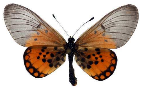
leucographa, forme sinalba, Tanzanie Bernaud (Cat EB).jpg sinalba