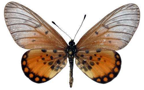
leucographa femelle, Isheri (Nigeria).jpg leucographa