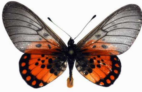
leucographa mâle Kibi (Ghana).jpg leucographa