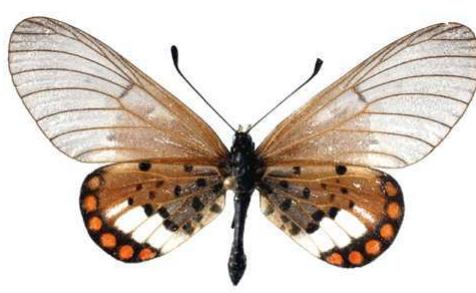
leucographa, femelle, Kakamega fst (Kenya) 44.JPG leucographa