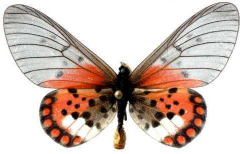
leucographa, Kakamega fst (Kenya) 40.JPG leucographa