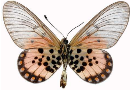
leucographa mâle, verso, Omo fst (Nigeria).jpg leucographa