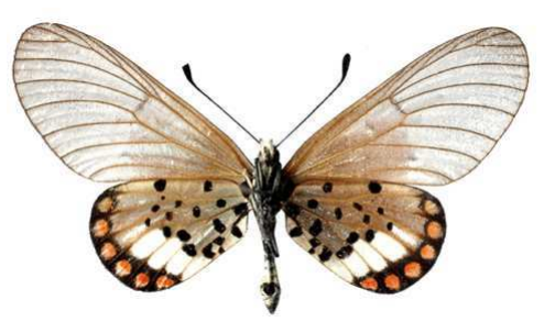
leucographa, femelle, verso, Kakamega fst (Kenya) 44.JPG leucographa