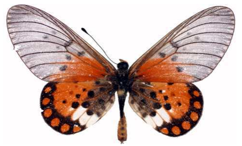
leucographa mâle, Kibale (Ouganda).jpg leucographa