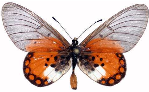
leucographa mâle, Ruhiga (Ouganda).jpg leucographa