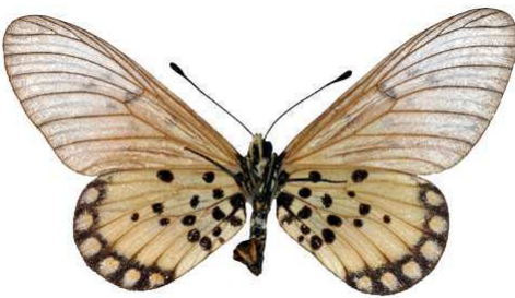
leucographa femelle, verso, Omo fst (Nigeria).jpg leucographa