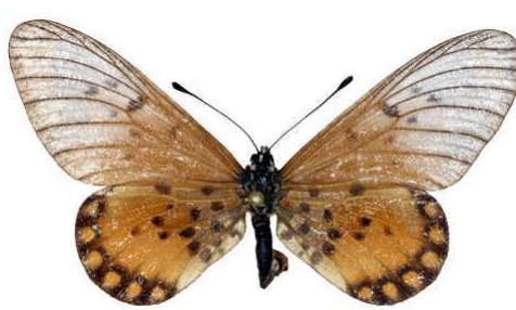
leucographa femelle, Omo fst (Nigeria).jpg leucographa