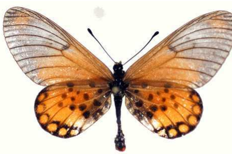
leucographa femelle Kafakumba (Zaïre).jpg leucographa