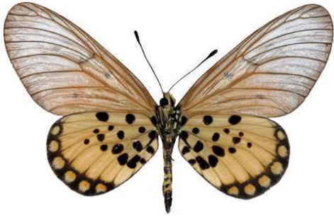
leucographa femelle, verso, Isheri (Nigeria).jpg leucographa