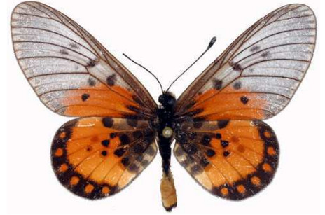
leucographa mâle, Omo fst (Nigeria).jpg leucographa