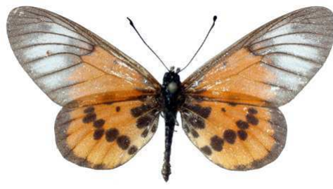
kakana, Oumbi (Ethiopie) Ungemach 40.JPG kakana