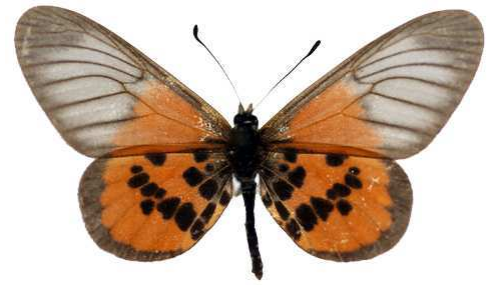
kakana, Oumbi, Sayo, Ethiopie MNHN (Cat EB).jpg kakana