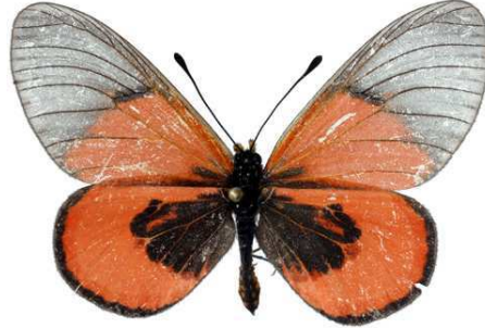
insignis, Uzumara (Malawi) Murphy 47.JPG insignis