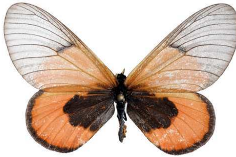
insignis femelle, Buyenvu fst (Ouganda).jpg sininna