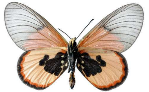
insignis, mâle, verso, Dodoma, Tanzanie, 46.JPG insignis