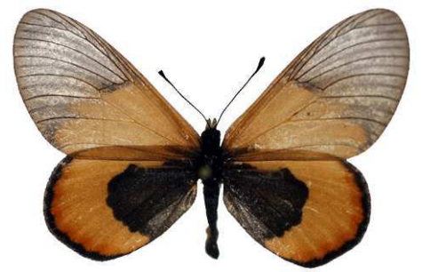
insignis, forme sininna, femelle, Kenya, Lukani Bernaud (Cat EB).jpg sininna