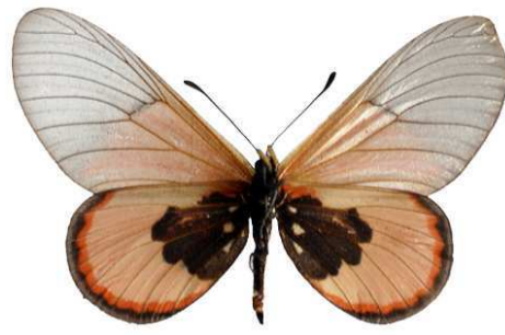
insignis femelle verso, Mawokota (Ouganda).jpg sininna