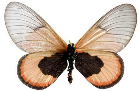
insignis femelle verso, Buyenvu fst (Ouganda).jpg sininna