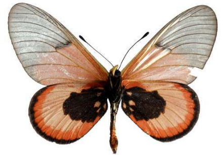
insignis mâle verso, Kome island (Ouganda).jpg sininna