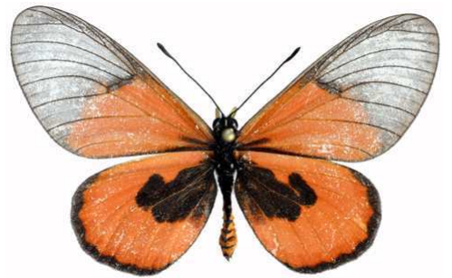
insignis mâle, Willindi fst (Malawi).jpg insignis