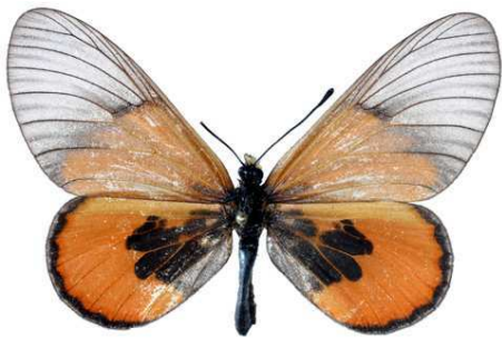
insignis, femelle, recto, Dodoma, Tanzanie, 54.JPG insignis