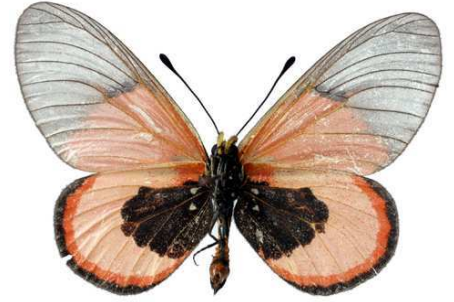
insignis, verso, Uzumara (Malawi) Murphy 47.JPG insignis