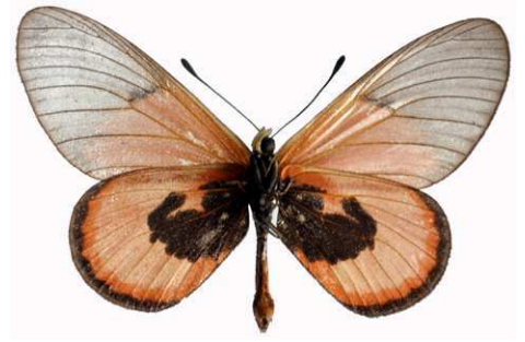
insignis mâle verso, Mawokota (Ouganda).jpg insignis