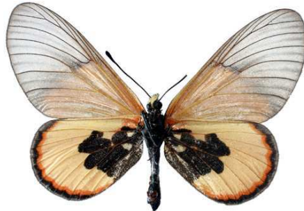
insignis, femelle, verso, Dodoma, Tanzanie, 54.JPG insignis