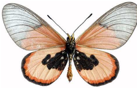
insignis mâle verso, Willindi fst (Malawi).jpg insignis