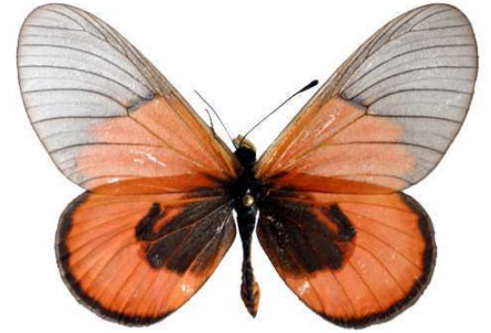
insignis mâle, Metu hill (Ouganda).jpg insignis