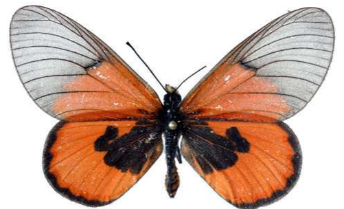
insignis, mâle, recto, Dodoma, Tanzanie, 46.JPG insignis