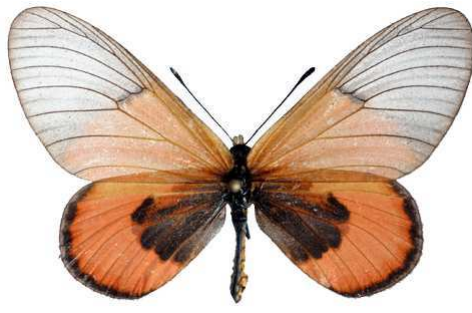
insignis mâle 2, Mawokota (Ouganda).jpg insignis