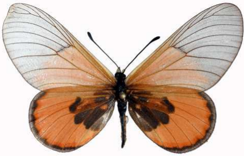
insignis femelle, Mawokota (Ouganda).jpg sininna