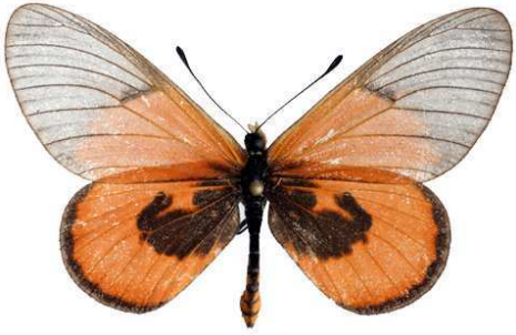
insignis mâle, Mawokota (Ouganda).jpg insignis