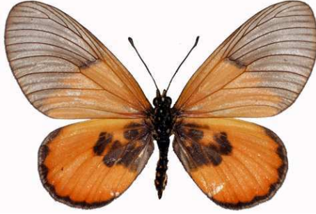
insignis mâle, Mulanje mt (Malawi) RM.jpg insignis