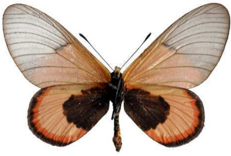
insignis mâle 2 verso, Mawokota (Ouganda).jpg insignis