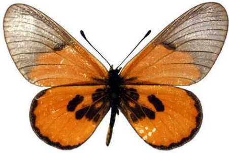
insignis, Zanzibar, Tanzanie MNHN (Cat EB).jpg insignis