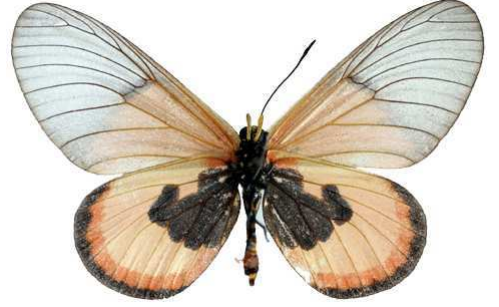
insignis femelle verso, Willindi fst (Malawi).jpg insignis