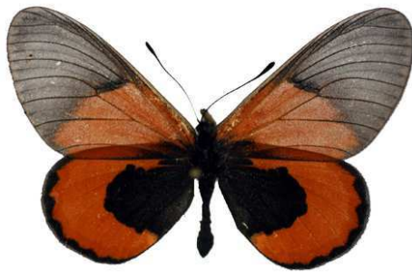
insignis, forme sininna, Kenya, Lukani Bernaud (Cat EB).jpg sininna