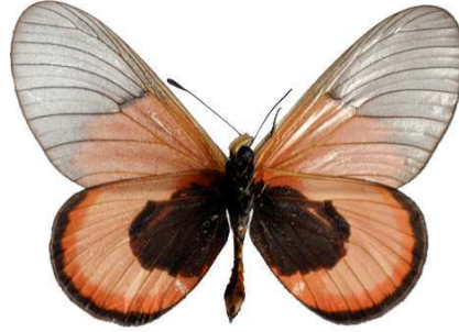
insignis mâle verso, Metu hill (Ouganda).jpg insignis