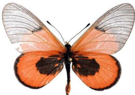
insignis mâle, Kome island (Ouganda).jpg siginna