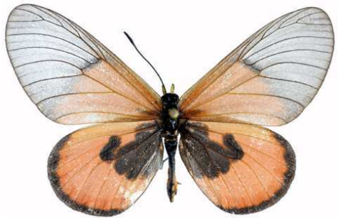
insignis femelle, Willindi fst (Malawi).jpg insignis