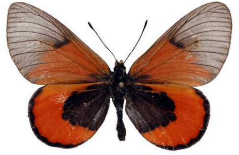
insignis femelle, Mughese fst (Malawi) RM.jpg sininna