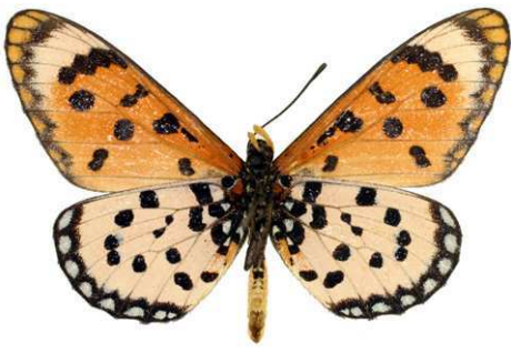
hypoleuca, mâle, verso, Khumid - Kaokoland, Namibie, 44.JPG hypoleuca