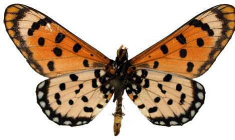
hypoleuca, verso, Khumib, Kackoland, NO Namibie MNHN (Cat EB).jpg hypoleuca