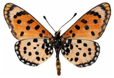
hypoleuca mâle, verso, Khumib riv. (Namibie).jpg hypoleuca