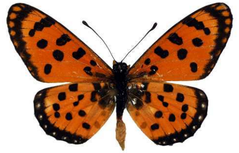
hypoleuca, Khumib, Kackoland, NO Namibie MNHN (Cat EB).jpg hypoleuca