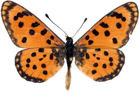
hypoleuca mâle, Khumib riv. (Namibie).jpg hypoleuca