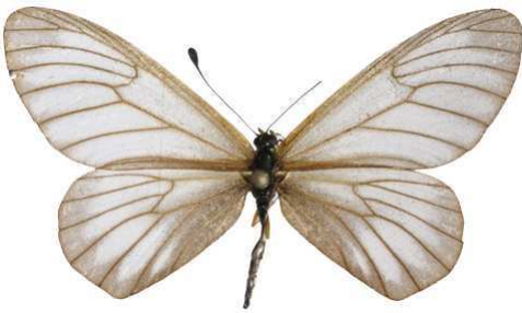
humilis femelle 2, Kalinzu fst (Ouganda).jpg humilis