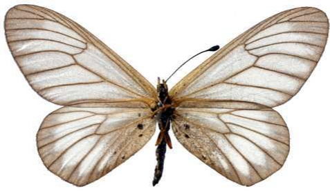
humilis, femelle, verso, Kasuo - Kivu (Zaire) Ducarme 42.JPG humilis