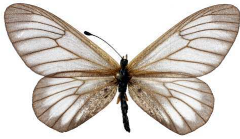
humilis, femelle, Kasuo - Kivu (Zaire) Ducarme 42.JPG humilis