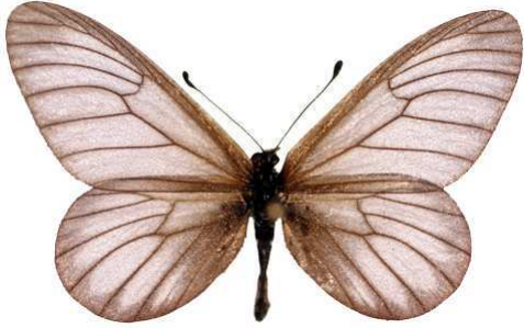
humilis mâle, Mawokota (Ouganda).jpg humilis