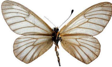
humilis femelle 2 verso, Kalinzu fst (Ouganda).jpg humilis