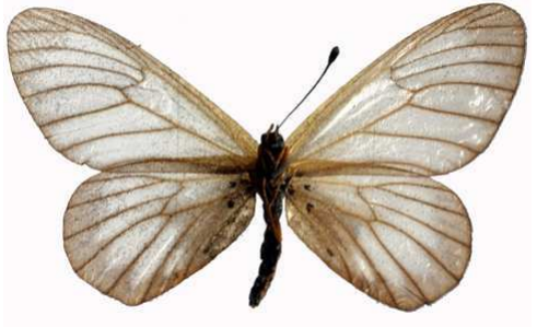
humilis femelle verso, Kalinzu fst (Ouganda).jpg humilis