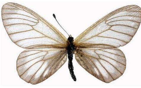
humilis femelle, Kalinzu fst (Ouganda).jpg humilis