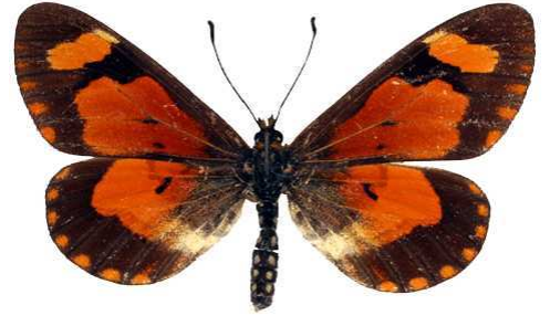
goetzei femelle, Juniper fst - Nyika (Malawi) RM.jpg goetzei