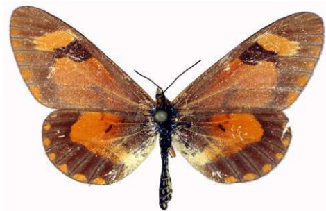
goetzei femelle, Rugege (Ruanda).jpg goetzei