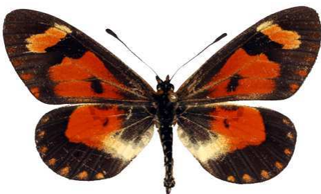
goetzei femelle, Ruo river (Malawi) RM.jpg goetzei