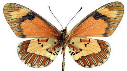
goetzei femelle verso, Thazima - Nyika (Malawi).jpg goetzei