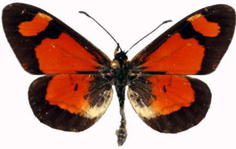
goetzei mâle, Juniper fst - Nyika (Malawi) RM.jpg goetzei