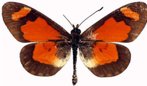
goetzei mâle, Muloza stream - Mulanje (Malawi) RM.jpg goetzei