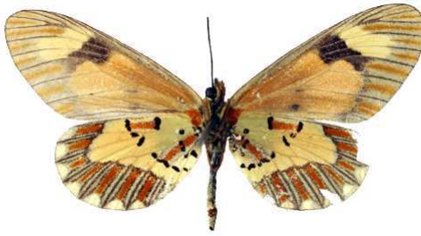
goetzei femelle verso, Kigezi (Ouganda).jpg goetzei