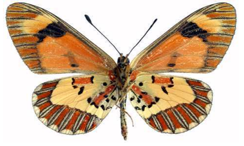
goetzei femelle verso, Chepolwe fst - Nyika (Malawi).jpg goetzei