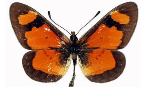
goetzei mâle, Echuya fst (ouganda).jpg goetzei