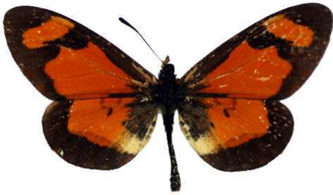
goetzei, Mulanje, Malawi Bernaud (Cat EB).jpg goetzei