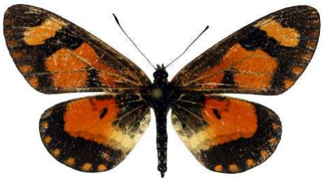
goetzei, femelle, Zomba, Malawi MNHN (Cat EB).jpg goetzei