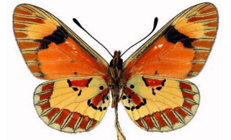
goetzei mâle, verso, Echuya fst (ouganda).jpg goetzei