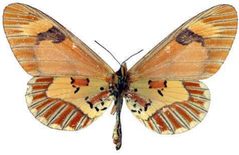
goetzei femelle verso, Rugege (Ruanda).jpg goetzei