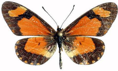
goetzei femelle, Thazima - Nyika (Malawi).jpg goetzei