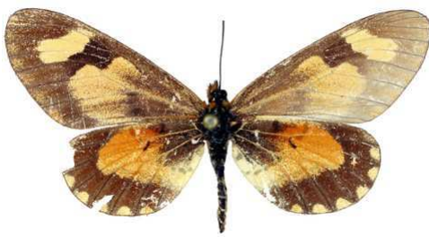
goetzei femelle, Kigezi (Ouganda).jpg goetzei