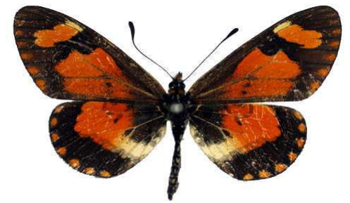
goetzei femelle, Mulanje (Malawi).jpg goetzei