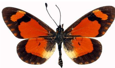
goetzei mâle, Chisanga - Nyika (Malawi) RM.jpg goetzei