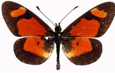
goetzei mâle, Uzumara (Malawi) RM.jpg goetzei