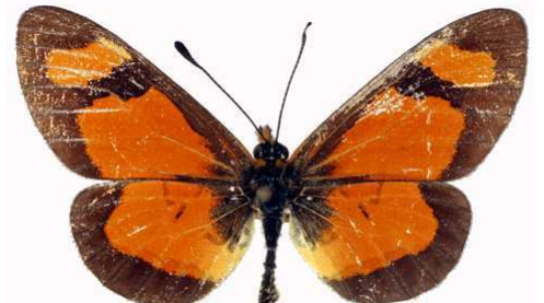
goetzei mâle, Parc Akagera (Ruanda).jpg goetzei