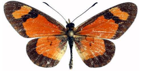
goetzei mâle 2, Dedza mt (Malawi).jpg goetzei