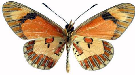
goetzei mâle 2 verso, Dedza mt (Malawi).jpg goetzei