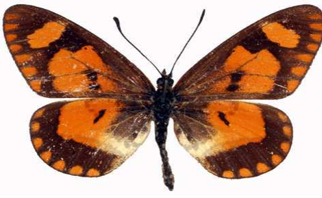
goetzei femelle, Zomba (Malawi) RM.jpg goetzei