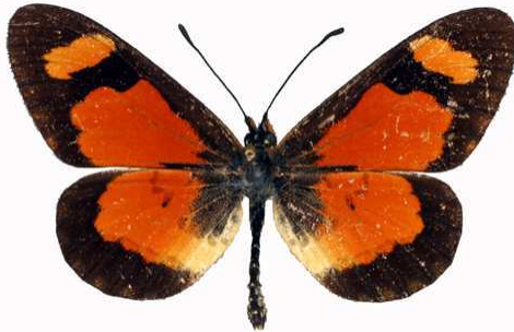
goetzei mâle, Mughese fst (Malawi) RM.jpg goetzei