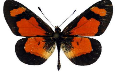
goetzei mâle, Zomba (Malawi).jpg goetzei