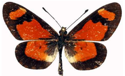
goetzei mâle, Ruo river (Malawi) RM.jpg goetzei