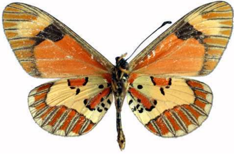
goetzei mâle verso, Dedza mt (Malawi).jpg goetzei