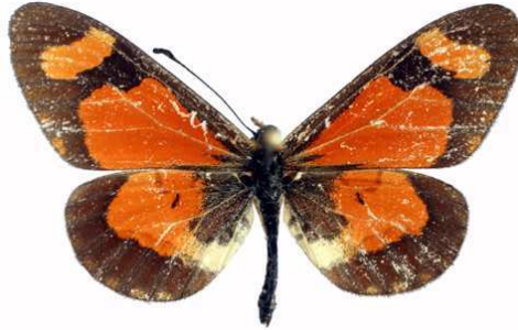
goetzei mâle, Dedza mt (Malawi).jpg goetzei