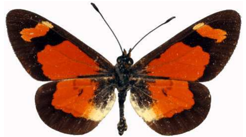
goetzei mâle, Nganda - Nyika (Malawi) RM.jpg goetzei