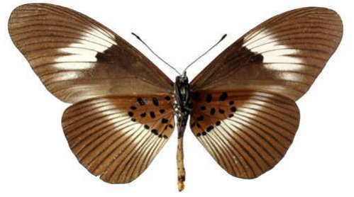
formosa, femelle, verso, Eala (Zaire) J. Ghesquière 88.JPG formosa