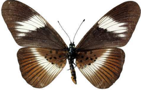
formosa, femelle, Maluku (Zaire) Joly 85.JPG formosa