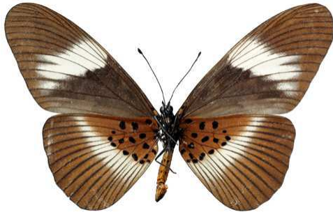
formosa, femelle, verso, Maluku (Zaire) Joly 85.JPG formosa