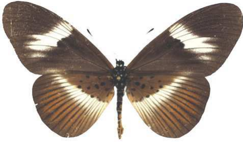
formosa, femelle, RCA Bernaud (Cat EB).jpg formosa