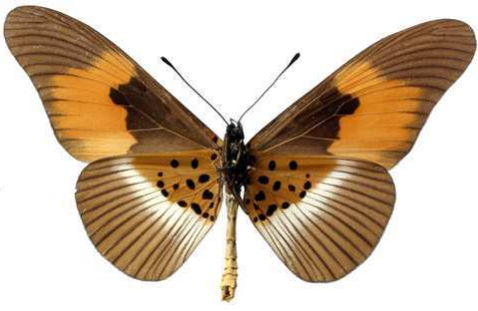
formosa, verso, Eala (Zaire) J. Ghesquière 74.JPG formosa