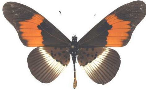
formosa, Kinshasa, RD Congo Bernaud (Cat EB).jpg formosa