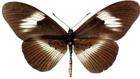
formosa, femelle, Eala (Zaire) J. Ghesquière 88.JPG formosa