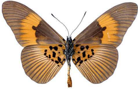
excisa, mâle, verso, Boende, R.D. Congo, 68.JPG excisa