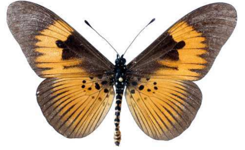
excisa, mâle, recto, Mt Pico - Malabo, Guinée Equatoriale, 76.JPG excisa