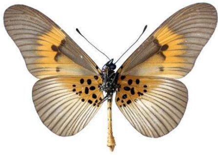
excisa, mâle, verso, Vaku - Mayombe, R.D. Congo, 64.JPG excisa