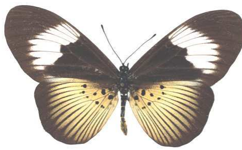
excisa, femelle, Ebogo, Cameroun Bernaud (Cat EB).jpg excisa