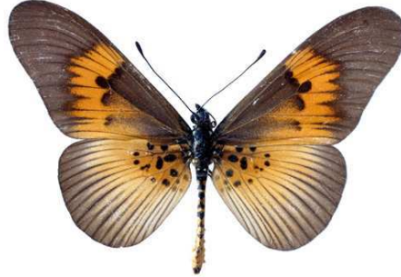
excisa, mâle, recto, Vaku - Mayombe, R.D. Congo, 64.JPG excisa