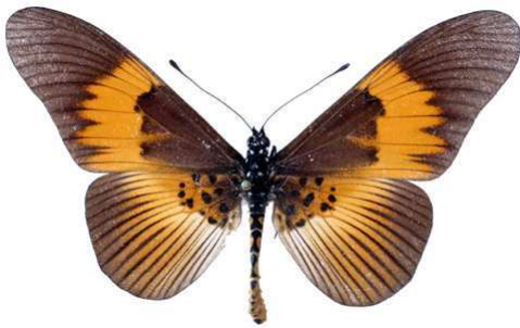
excisa, mâle, recto, Kassai, R.D. Congo, 72.JPG excisa