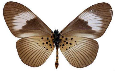
excisa femelle, verso, Okomu (Nigeria).jpg excisa