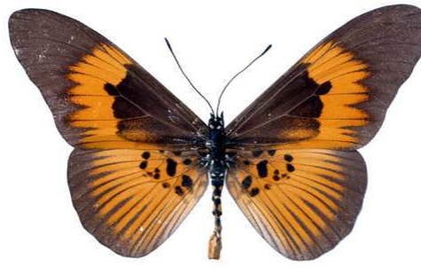
excisa, mâle, recto, Boende, R.D. Congo, 68.JPG excisa