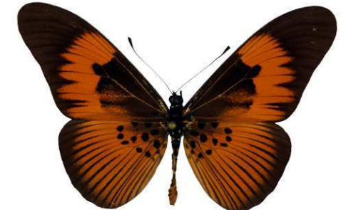
excisa, Douala, Cameroun Bernaud (Cat EB).jpg excisa