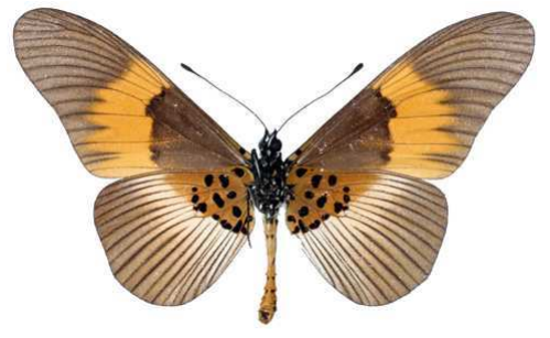
excisa, mâle, verso, Kassai, R.D. Congo, 72.JPG excisa