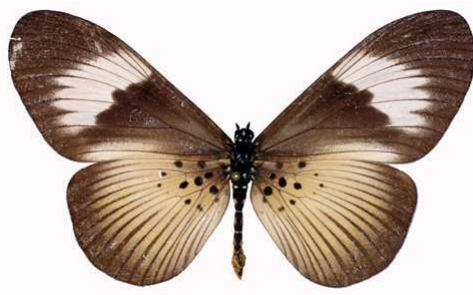
excisa femelle, Okomu (Nigeria).jpg excisa