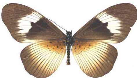
excisa, femelle, Salazar, Angola MNHN (Cat EB).jpg peregrina