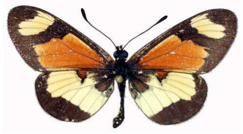
excelsior mâle, Aberdares King (Kenya).jpg excelsior