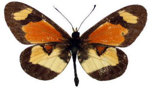
excelsior, Kenya Bernaud (Cat EB).jpg excelsior