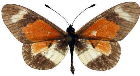
excelsior usambarae, Ngorongoro, Tanzanie MNHN (Cat EB).jpg usambarae