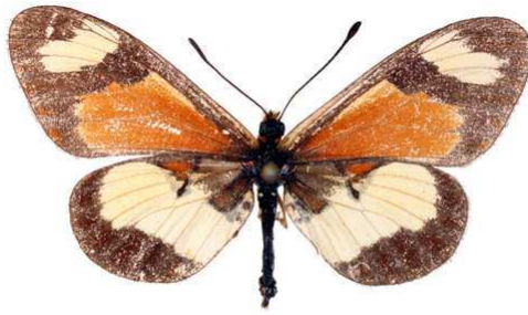
excelsior, femelle, recto, Aberdare, Kenya, 37.JPG excelsior