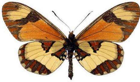
excelsior, femelle, verso, Kinangop, Kenya MNHN (Cat EB).jpg excelsior