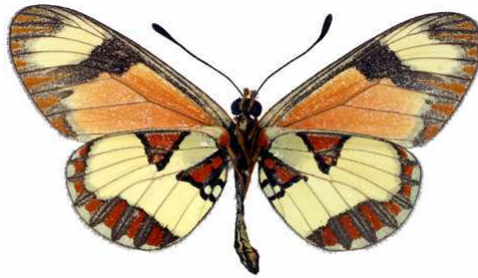
excelsior mâle, verso, Aberdares King (Kenya).jpg excelsior