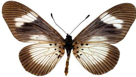
esebria femelle verso, Kouale (Mayotte).jpg protea