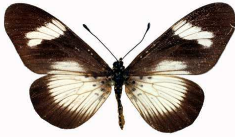
esebria femelle, Kouale (Mayotte).jpg protea