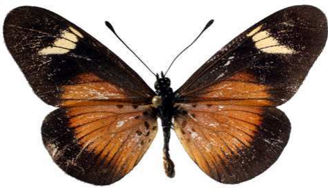
esebria 2, Cholo mt (Malawi) 46.JPG esebria