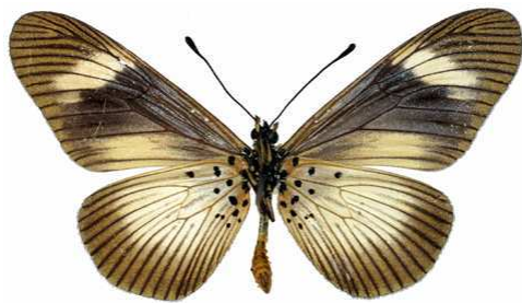
esebria mâle verso, Kouale (Mayotte).jpg protea