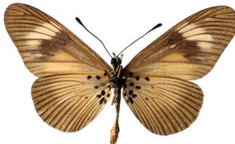
esebria, verso, Rabbai hills (Kenya) Turlin 48.JPG esebria