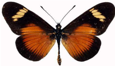
esebria mâle 2, Ntchisi fst (Malawi) RM.jpg esebria