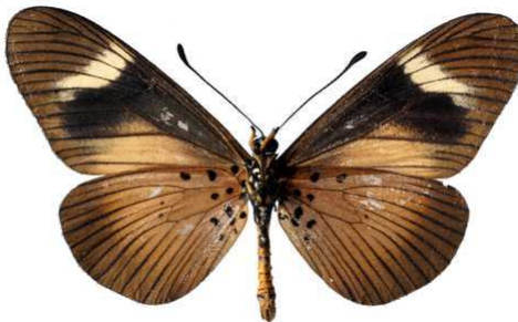
esebria, verso, Cholo mt (Malawi) 46.JPG esebria