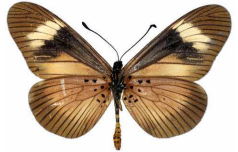
esebria mâle, verso, Ntchisi fst (Malawi).jpg esebria