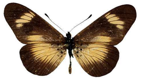
esebria, Usumbara mts, Tanzanie Bernaud (Cat EB).jpg protea