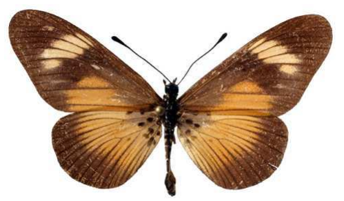
esebria, Rabbai hills (Kenya) Turlin 48.JPG esebria