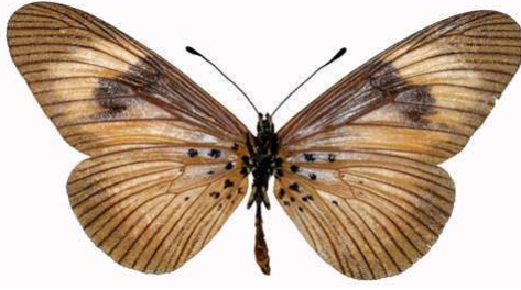
esebria femelle f. actinotis verso, Ambangulu - Usambara (Tanzanie).jpg esebria