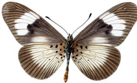
esebria, femelle, verso, Rubeho mts, Tanzanie, 57.JPG monteironis