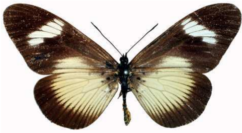
esebria, f. femelle, Natal MNHN (Cat EB).jpg protea