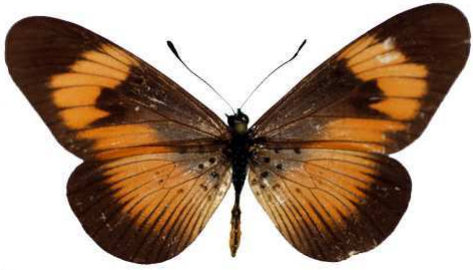
esebria, Usambara, Tanzanie MNHN (Cat EB).jpg actinotis