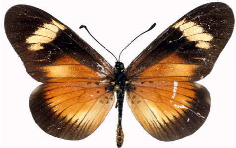
esebria mâle, Ntchisi fst (Malawi).jpg esebria