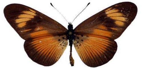
esebria, Shimba hills, Kenya MNHN (Cat EB).jpg actinotis