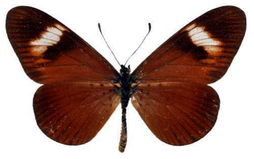
esebria femelle, Kasitu rock (Malawi) RM.jpg esebria