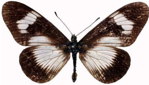
esebria femelle 1, Ntchisi fst (Malawi) RM.jpg monteironis