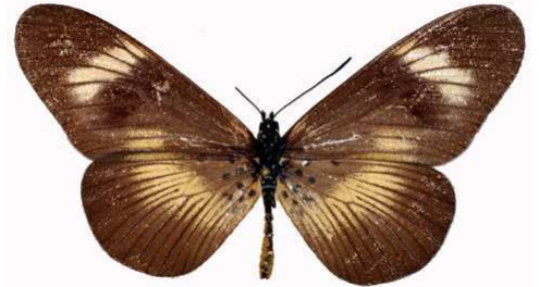
esebria mâle, Shaba (R.D. Congo).jpg esebria