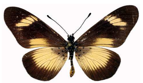
esebria mâle, Kouale (Mayotte).jpg protea