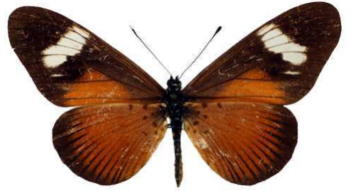
esebria, f. femelle, Tanga, Usumbara mts, Tanzanie MNHN (Cat EB).jpg esebria