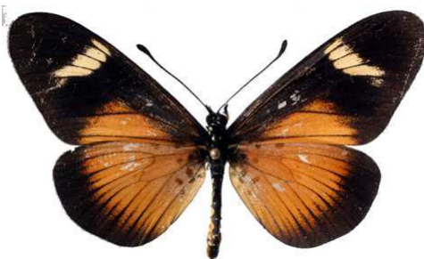
esebria, Cholo mt (Malawi) 46.JPG esebria