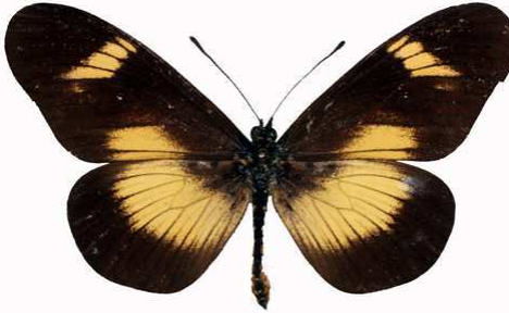
esebria mâle 1, Ntchisi fst (Malawi) RM.jpg protea