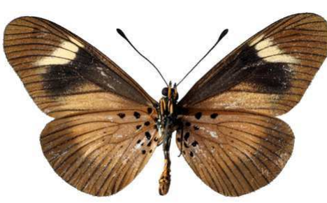
esebria 2, verso, Cholo mt (Malawi) 46.JPG esebria