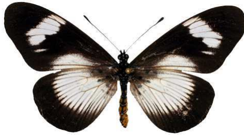
esebria femelle, Ruo river (Malawi) RM.jpg protea