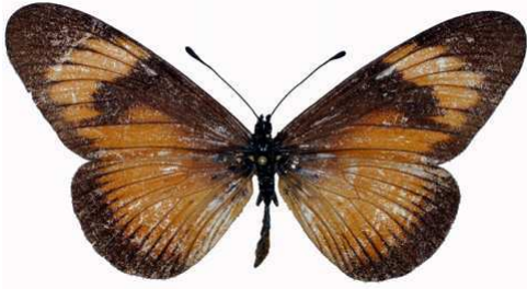
esebria femelle f. actinotis, Ambangulu - Usambara (Tanzanie).jpg esebria