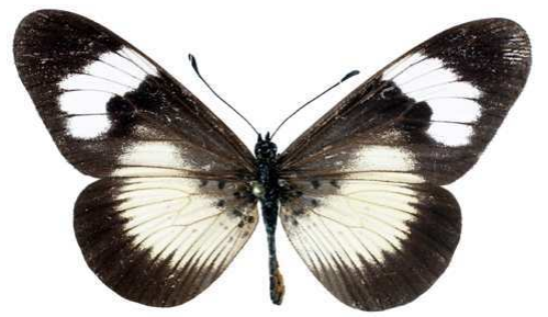
esebria, femelle, recto, Rubeho mts, Tanzanie, 57.JPG monteironis