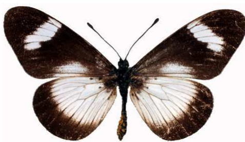
esebria femelle, Muloza str - Mulanje (Malawi) RM.jpg protea