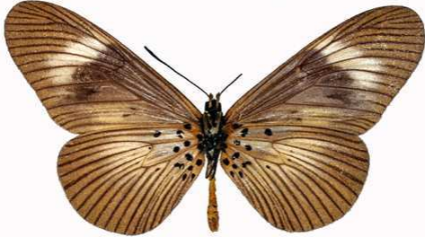
esebria mâle verso, Shaba (R.D. Congo).jpg esebria