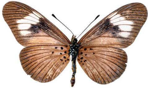
esebria, femelle, verso, Thyolo, Malawi, 52.JPG esebria