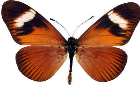
esebria femelle, Limbe (Malawi) RM.jpg esebria