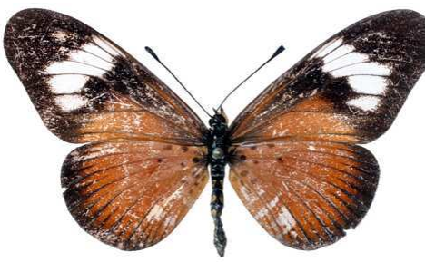
esebria, femelle, recto, Thyolo, Malawi, 52.JPG esebria