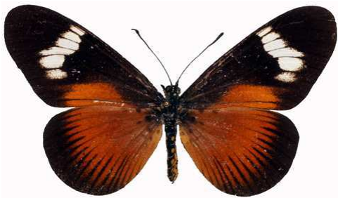
esebria femelle 2, Ntchisi fst (Malawi) RM.jpg esebria