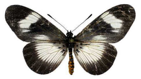
esebria femelle, Mulanje (Malawi).jpg monteironis