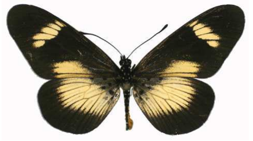
esebria mâle, Thyolo (Malawi).jpg protea