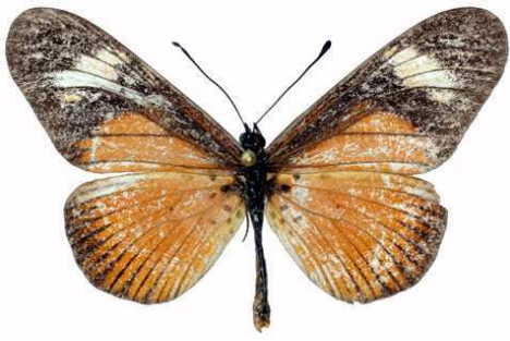
esebria mâle, Mughese fst (Malawi).jpg esebria