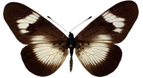
esebria, f. femelle, Ambangulu, Usumbara mts, Tanzanie Bernaud (Cat EB).jpg monteironis