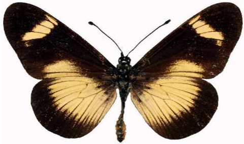
esebria mâle, Ruo river (Malawi) RM.jpg protea