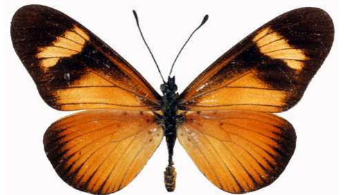
esebria mâle 2, Muloza str - Mulanje (Malawi) RM.jpg actinotis