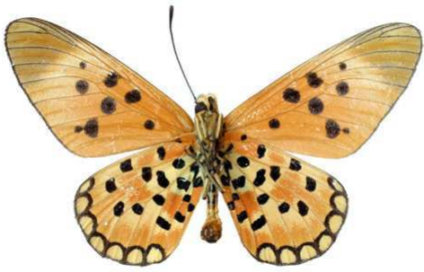
annonae, verso, Kapiri (Zaire) 47.JPG annonae