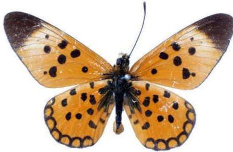
annonae, Kapiri (Zaire) 47.JPG annonae