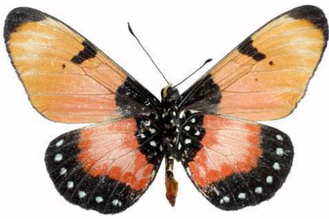
anemosa mâle verso, Vwaza Marsh (Malawi).jpg anemosa