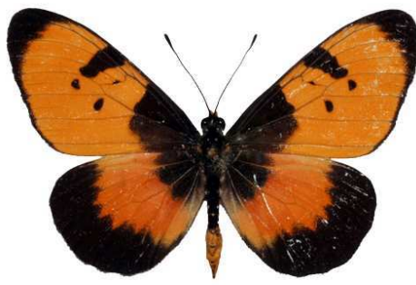
anemosa mâle, Blantyre (Malawi) RM.jpg anemosa