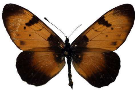
anemosa, Mpanda, Tanzanie MNHN (Cat EB).jpg anemosa