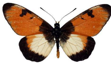
anemosa alboradiata, Victoria falls, Zimbabwe MNHN (Cat EB).jpg alboradiata