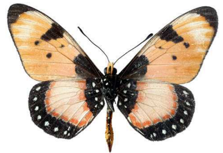
anemosa, mâle, verso, Dodoma, Tanzanie, 56.JPG anemosa