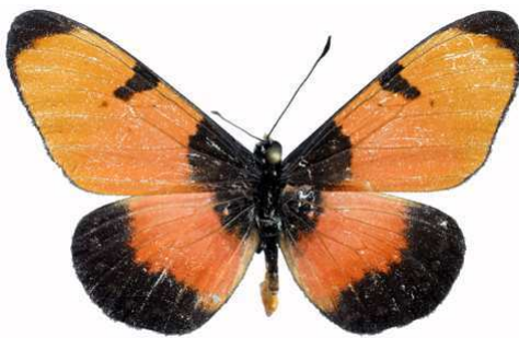
anemosa mâle, Vwaza Marsh (Malawi).jpg anemosa