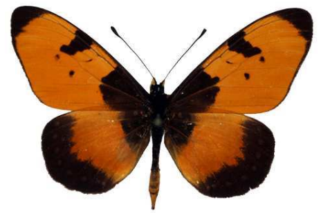
anemosa, Mpanda, Tanzanie Bernaud (Cat EB).jpg anemosa