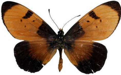
anemosa femelle, Gowati (Malawi) RM.jpg anemosa