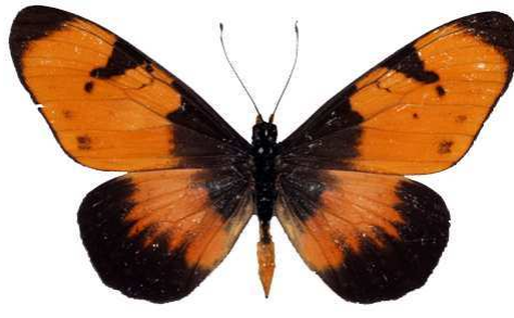
anemosa mâle, Mpatumanga - Shire river (Malawi) RM.jpg anemosa