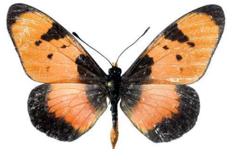
anemosa, mâle, recto, Dodoma, Tanzanie, 56.JPG anemosa