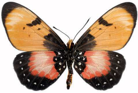
anemosa femelle verso, Vwaza Marsh (Malawi).jpg anemosa