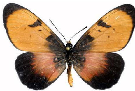
anemosa femelle, Vwaza Marsh (Malawi).jpg anemosa