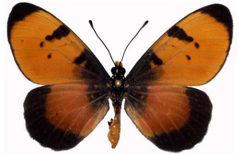
anemosa femelle, Rumphi - Thumbi school (Malawi) RM.jpg anemosa