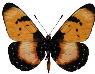
anemosa, verso, Chikweta, Mahenge, Tanzanie MNHN (Cat EB).jpg anemosa