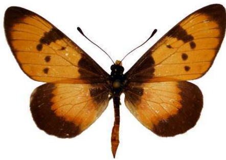
anemosa, Galana river, Kenya.jpg anemosa