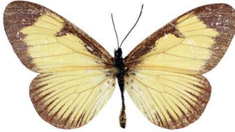
alciopoides mâle, Kayonza forest (Ouganda).jpg alciopoides