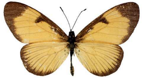
alciopoides, Kigezi, Uganda Bernaud (Cat EB).jpg alciopoides