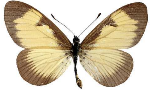
alciopoides mâle, Kayonza fst (Ouganda).jpg alciopoides