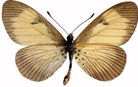
alciopoides mâle verso, Kayonza fst (Ouganda).jpg alciopoides