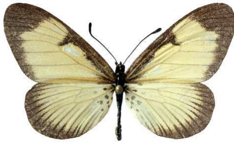
alciopoides, Lubero (Zaire) 38.JPG alciopoides