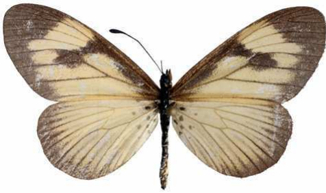
alciopoides femelle, Itwara fst (Ouganda).jpg alciopoides