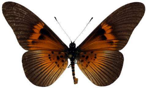
alcinoe alcinoe, Etinde, Cameroun Bernaud (Cat EB).jpg camerunica