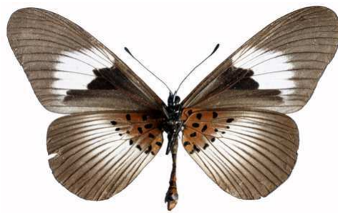
alcinoe femelle verso, Mawokota (Ouganda).jpg alcinoe