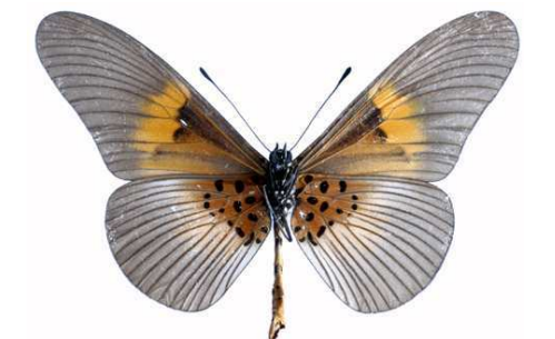
alcinoe mâle verso, Kisubi (Ouganda).jpg alcinoe