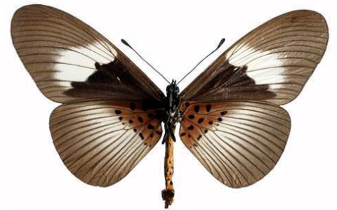
alcinoe femelle 2 verso, Mawokota (Ouganda).jpg alcinoe