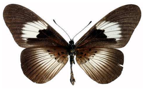
alcinoe femelle, Mawokota (Ouganda).jpg alcinoe