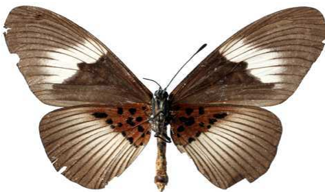
alcinoe, femelle, verso, Principe (Sao Tome & Principe) Turlin 75.JPG alcinoe