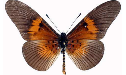
alcinoe mâle, Kisubi (Ouganda).jpg alcinoe