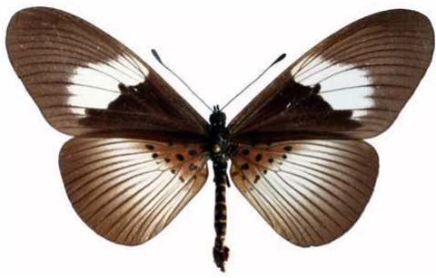
alcinoe femelle 2, Mawokota (Ouganda).jpg alcinoe