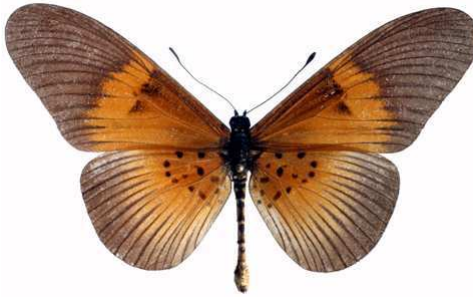
alcinoe mâle 2, Kisubi (Ouganda).jpg alcinoe