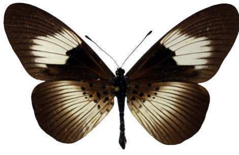
alcinoe alcinoe, femelle, Ghana Bernaud (Cat EB).jpg alcinoe