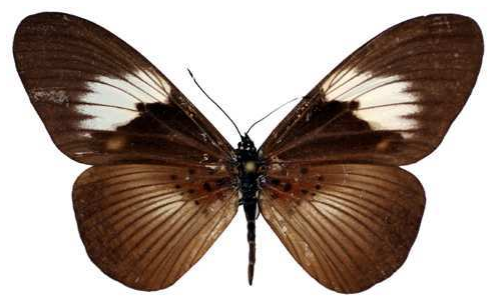
alcinoe femelle, Kananga (Zaire) 2-87 Cat EB Bernaud.jpg alcinoe