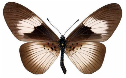
alcinoe femelle, Erin Ijesha (Nigeria).jpg alcinoe