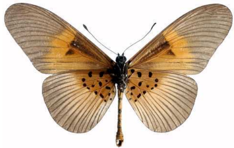
alcinoe mâle 2 verso, Kisubi (Ouganda).jpg alcinoe