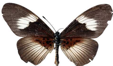
alcinoe, femelle, Principe (Sao Tome & Principe) Turlin 75.JPG alcinoe