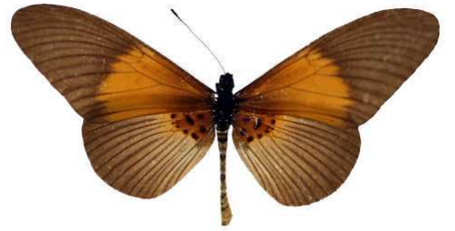
alcinoe nado, Bouré, Ethiopie MNHN (Cat EB).jpg nado